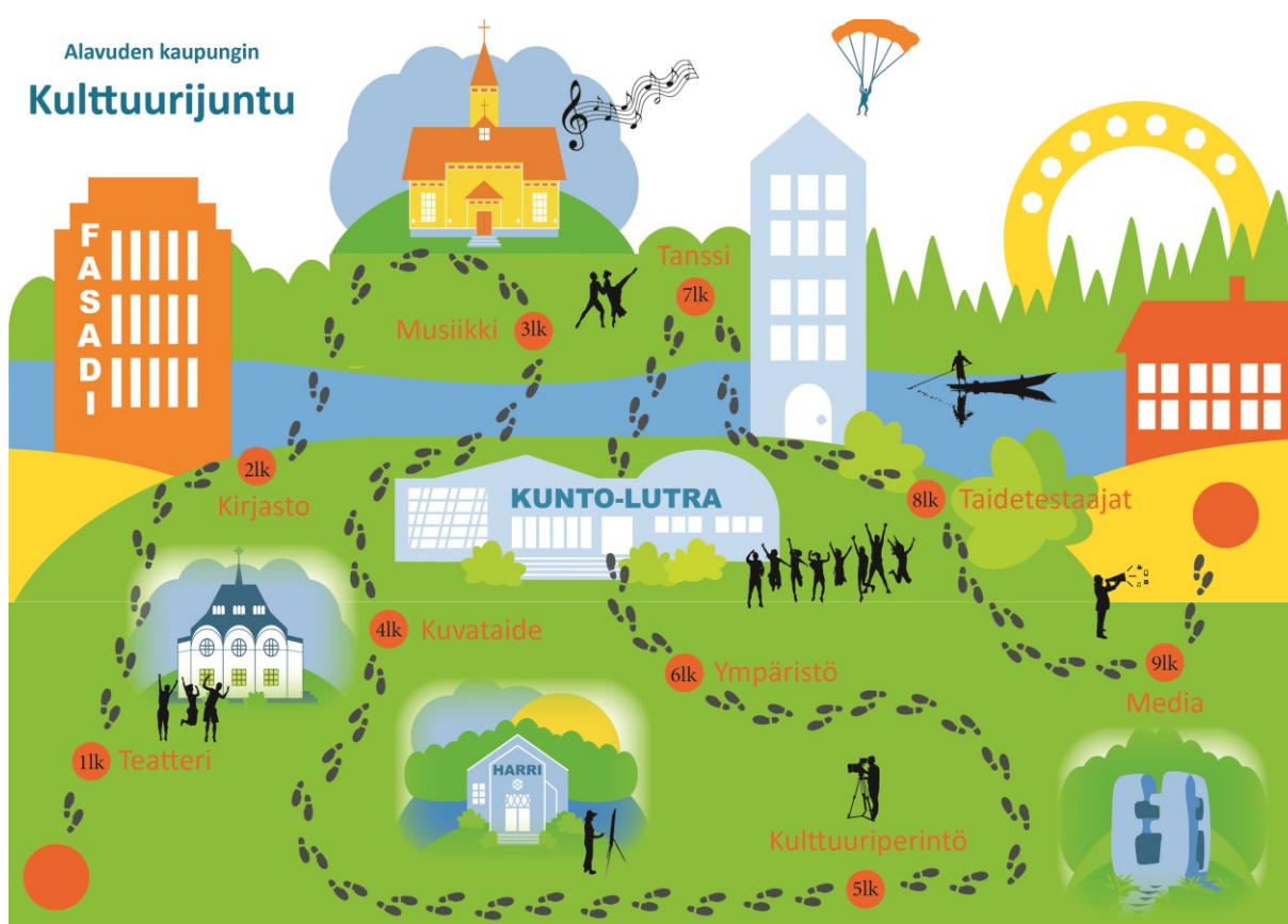
Kuva 2: Kulttuurijuntu, graafinen versio

Benchmarkkauksen aikana huomasin kiinnostuvani lukijana tarkemmin suunnitelmista, jotka olivat visuaalisesti miellyttäviä, kun taas minun oli hankalampi saada otetta suunnitelmista, joiden ulkomuotoon ei ollut panostettu. Euran kulttuurikasvatussuunnitelma oli värikäs, leikkisä ja mukaansa tempaava kokonaisuus visuaalisesti, ja päätin tuoda samanlaista vivahteikkautta myös omaan suunnitelmaani. Päädyin kuitenkin tuomaan graafiseen suunnitelmaani tarkemmin omassa suunnitelmassani olevan termin juntu eli polku, jonka malliin suunnitelma on rakennettu. Tällöin Kulttuurijuntun visuaalisesta suunnitelmasta tuli aarrekartan omainen, lapsekas ja leikkisä representaatio kulttuurikasvatussuunnitelman sisällöistä, joka toistaa Alavuden kaupungin visuaalista ilmettä.