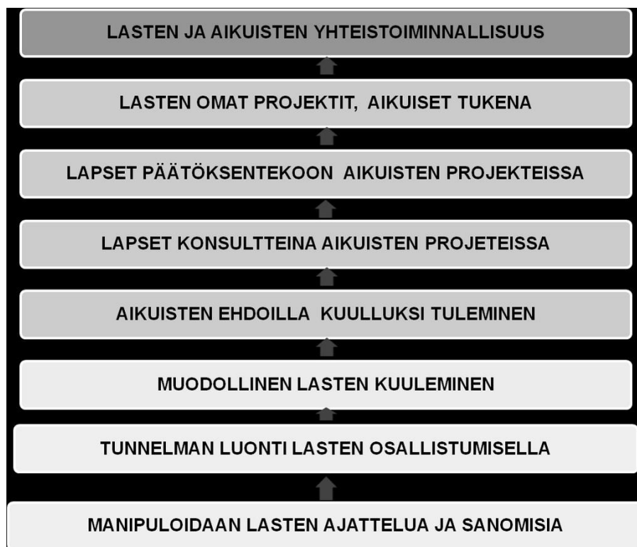
Kuvio 1: Hartin (1992) portaat (Turja 2011)

Hartin (1992) esittämässä porrasmallissa (Kuvio 1) on oleellista se, kuinka paljon lapselle annetaan informaatiota tulevasta toiminnasta, johon he osallistuvat, ja kuinka paljon he voivat vaikuttaa toimintaan tai kuinka he voivat säädellä omaa osallisuuttaan. Mitä enemmän lapselle tarjotaan informaatiota toiminnan taustoista tai tavoitteista, sitä enemmän lapsi tekee konkreettisia aloitteita, ideoi ja kokee halua vaikuttaa, eli valtaistuu. Mitä enemmän valtaistumista tapahtuu, sitä korkeammalle osallisuuden portaikolla nouseaan. (Turja 2011, 49.) Mitä vähemmän lapsella on tietoa toiminnan todellisesta tavoitteesta ja taustoista, sitä vähemmän lapsi pystyy määrittelemään toimintaansa, jolloin valtaistuminen toteutuu vain matalilla tasoilla. (Turja 2011.) Hartin mukaan ylintä osallisuuden tasoa edustaa tasavertainen aloitteellisuus ja yhteistoiminnallisuus. Tähän kuuluu neuvottelutilanteet niin lasten, kuin aikuistenkin kesken. (Turja 2011, 50.)