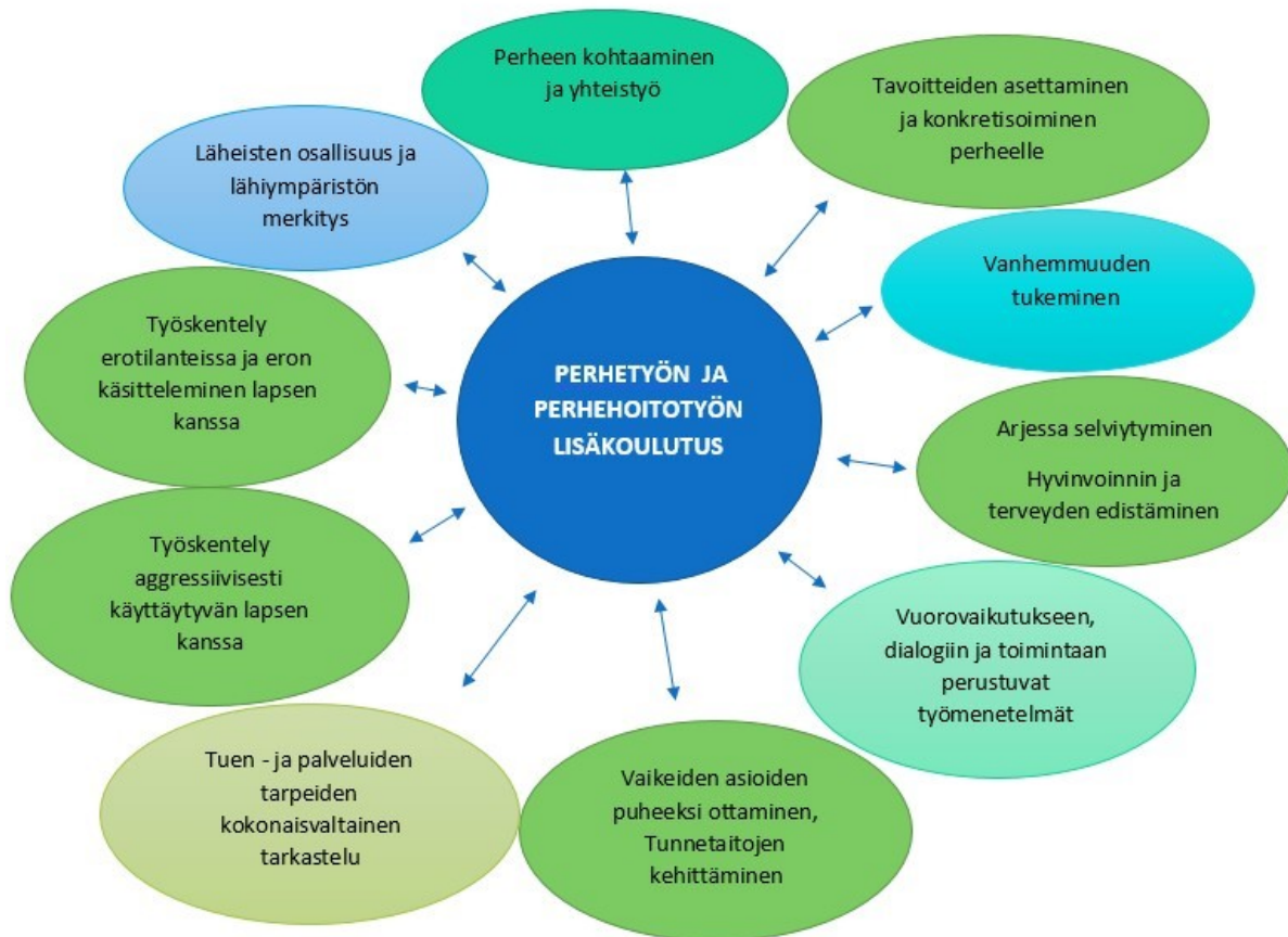
Kuvio 1. Ehdotuksia perhetyön ja perhehoitotyön lisäkoulutuksen sisällöiksi

Perhetyötä ja perhehoitotyötä käsittelevässä lisäkoulutuksessa painotuksen tulee olla työkäytännöissä ja -menetelmissä. SOTE-ammattilaiset ehdottivat lisäkoulutukseen muun muassa kuvion 1 mukaisia työkäytäntöihin ja -menetelmiin linkittyviä näkökulmia.