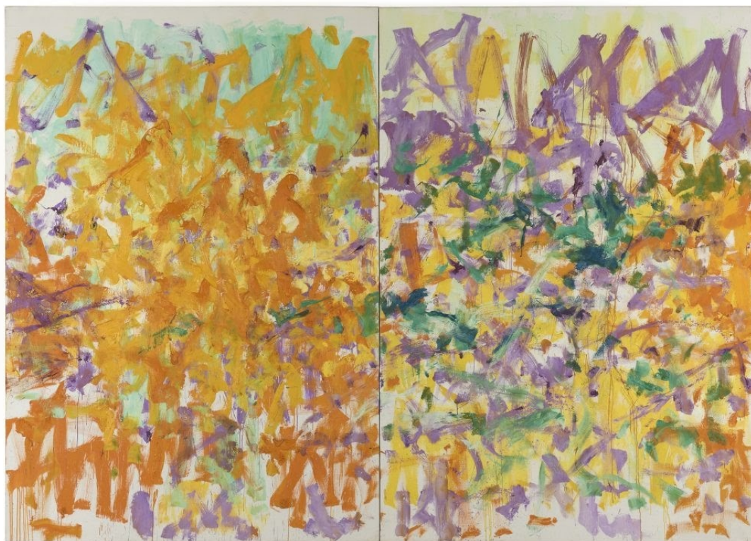
Joan Mitchell, Untitled, öljy kankaalle, 1979