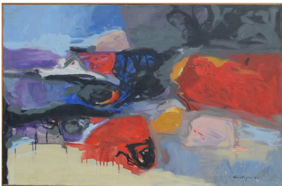
Grace Hartigan, Untitled, öljy kankaalle, 1960