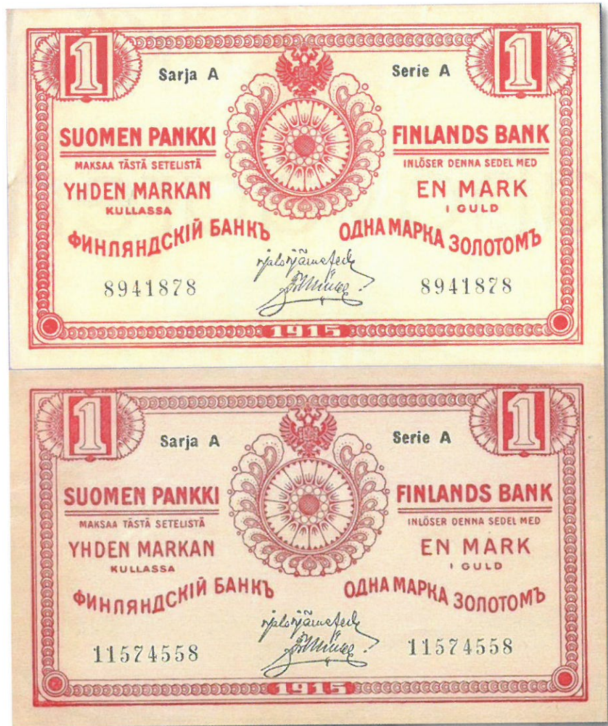
Kuva 1. 1 markan seteli mallia 1915 Sarja A. Ylempänä aito seteli, alempana moderni kopio. Kuvien yhdistely ja muokkaus: Jorma Impola SeAMK

Tämä viimeinen kuva 3 tuo esille tämän kopion suurimman heikkouden ja parhaan tunnistustekijän: kaikissa kopioissa on sarjanumero 11574558. Luonnollisestikaan ei ole takeita siitä, etteikö muitakin sarjanumeroita esiintyisi, mutta ainakin tällä hetkellä on kaikissa kaupan olevissa kopioissa tämä sama sarjanumero. Värikopiosetelien valikoimassa on niin kopeekka- ja ruplaseteleitä, Suomen Pankin kaikki tyypit ja jokunen Suomen Yhdyspankin ja yksi Vaasan Osake Pankinkin setelikopio. Myös Kansanvaltuuskunnankin setelit on huomioitu. Kopioijat ovat saaneet haltuunsa digikuvia eri seteleistä, joita hyväksi käyttäen on tuotettu näitä "reproduction":eita. Koska näitä tekeleitä on myöskin ilmestynyt Suomessakin myyntiin, viimeksi huuto.net -sivustoilla, on syytä varoittaa yleisöä ja keräilijöitä. Ja onpa näitä tekeleitä jo ilmestynyt huutokauppoihinkin: https://aukcejamonet.pl/product/36442/russia-finlandia-3-ruble-1861