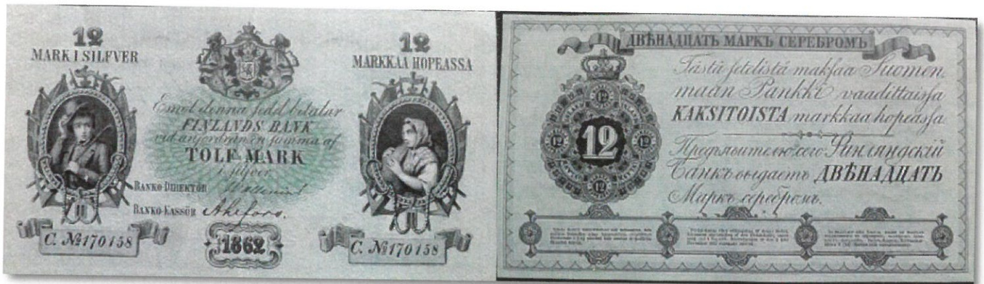
Kuva 9. 12 markkaa 1862 C. No 170158 kopio. Kopiosetelin paperin laatu on luonnollisesti erilaista kuin aidossa setelissä, mutta myyjien mukaan on tässä setelissä (kuten monissa muissakin kaupan olevissa kopioseteleissä) myös vesileima. Kuvien muokkaus ja yhdistely: Jorma Impola SeAMK

Suomalaisten seteleiden kopioita on tällä hetkellä liikkeellä ainakin seuraavasti: