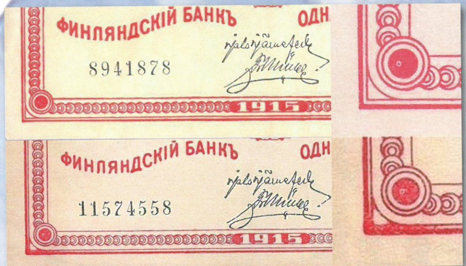
Kuva 2. 1 markka 1915 Sarja A. Vasempien alakulmien vertailua. Aito seteli ylempänä, kopio alempana. Kuvien yhdistely ja muokkaus: Jorma Impola SeAMK