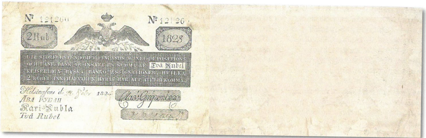
Kuva 8. 2 ruplaa 1828 No 121260 kopio. Kopiosetelin paperin laatu on luonnollisesti erilaista kuin aidossa setelissä, mutta koska alkuperäinen paperi on patinoitunut, on myös setelin kuvassa patinoituneen paperin väri, jonka kopioijat ovat ilmeisen onnistuneesti kopioineet.