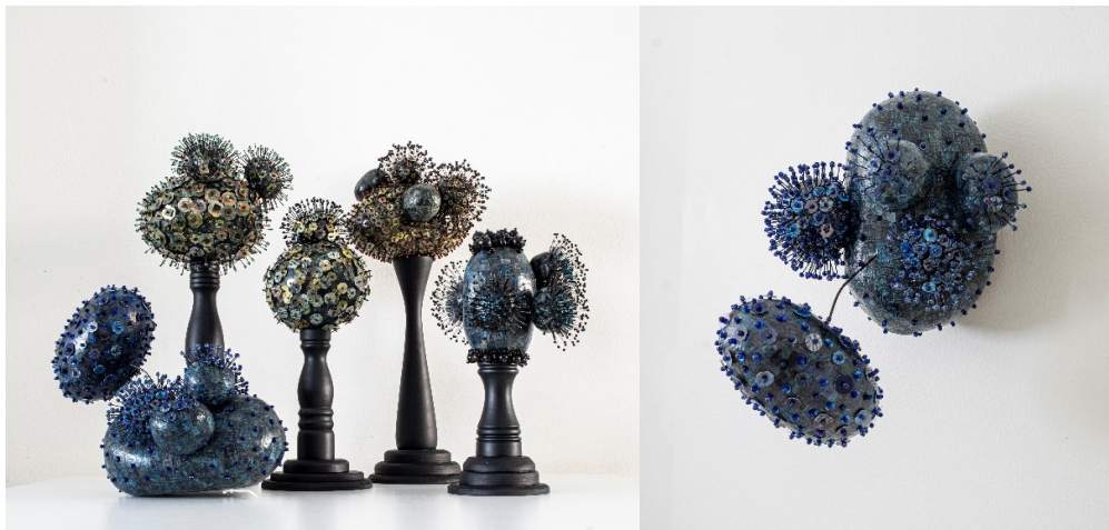
Kuvat 6 ja 7. Ihmekukka-veistokset, 2020-2021. Sekatekniikka. Koot vaihtelevat.

Minun salaisessa puutarhassani annan kaikenlaisten kukkien kukkia.