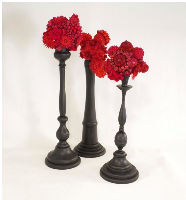
Kuva 14. Kukkakorallit, 2020. Sekatekniikka.