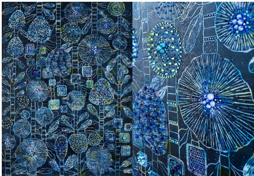
Kuvat 4 ja 5. Salainen puutarha I, 2019-2021. Tempera ja puupiiirros Hahnemühle-paperille sekä sekatekniikka. Teoksen koko 109 x 84 x 6 cm.

Mummini, aikuisin silmin katsottuna, hyvinkin vaatimattomat pihakasvit, saivat vuosien varrella kasvitieteellisten puutarhojen floorasta uusia vivahteita mielikuviini. Mirabilis, tämä ihmekukkien heimo kasvoi mieleni puutarhoissa. Kerrokselliset kukkateokset ilmentävät sisäistä maailmaani sekä monissa puutarhoissa nähtyä ja koettua.