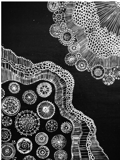
Kuva 13. Ornamentti, 2019. Puupiirros japaninpaperille, koko 69,5 x 55 cm.