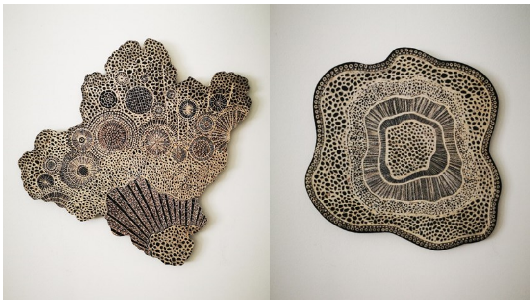
Kuvat 11 ja 12. Puun pitsiä -installaation osia, 2020-2021. Puukaiverrus koivuvanerille. Installatioon kuuluu useita osia, joiden koot vaihtelevat.

Valokuvamuistoni toivat mieleeni myös lähisukuni tehdyt käsityöt. Ajattelin Puun pitsiä -installaation olevan kuin muisto isovanhemmistani ja heidän kädentaidoistaan. Mummini virkkasi ja äidinisäni teki puukaiverrustauluja. Installaationi teoksissa heidän taitonsa ikään kuin yhdistyivät pitsimäisissä vanerireliefeissä. Huomasin sitä miina puhuttelevaa runsasta koristeellista ornamenttiikkaa mummini pitseissä ja äidinisäni tekemässä korurasiassa. Nämä kuviot olivat minulle tuttuja jo vuosikymmenien takaa. Ehkä runsas kädenjälkeni onkin peräisin näistä muistikuvista?