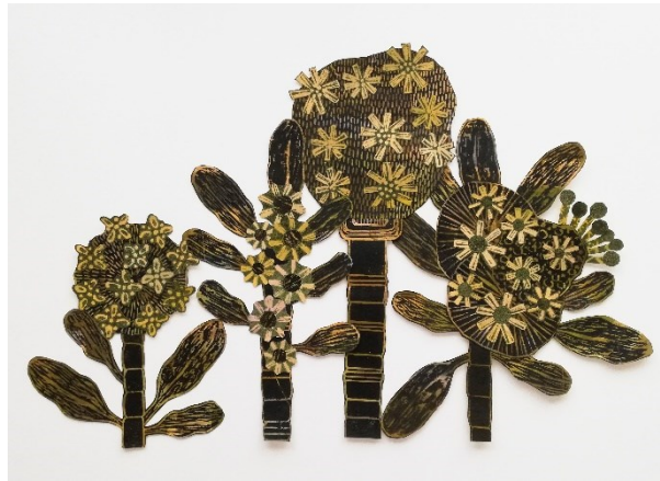
Kuva 8. Seinäkukat, 2021. Puupiiirros. Koot, muodot ja värit vaihtelevat.