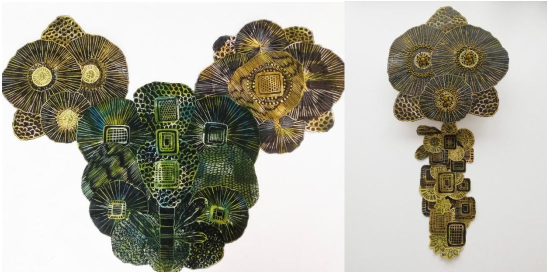
Kuvat 9 ja 10. Seinäkukat, 2021. Puupiiirros- ja sekateknikka. Koot vaihtelevat.