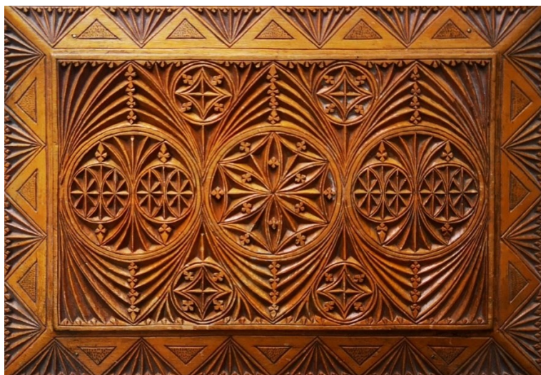
Kuva 3. Korurasian kansi. Oiva Salmivaara 1933.