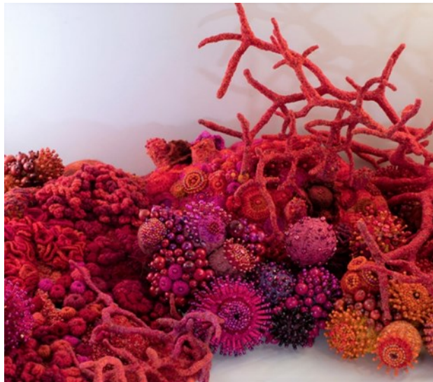
Kuva 15. Yksityiskohta Punainen meri -installaatiosta.

jopa vuosien mittainen, kunnes sisäiselle näkemykselle löytyy riittävän hyvä ilmaisu-tapa ja -muoto. Luovaa ilmaisua ei synny, jos itsetuntemus ja taidot eivät riitä syvällisen kokemuksen ilmaisemiseen. Kun esimerkiksi mahdolliset sisäiset ristiriidat kyetään selvittämään, löytyy myös mahdollisuus sisäisen näkymän toteuttamiseen.