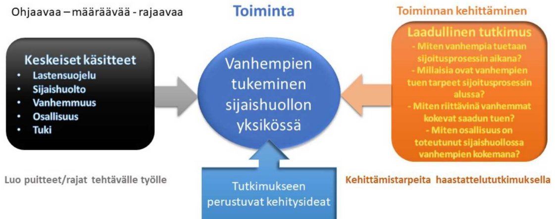
Kuvio 1. Opinnäytetyön viitekehys

riittävinä vanhemmat kokevat saadun tuen? Sekä miten osallisuus on toteutunut sijaishuollossa vanhempien kokemana? Näihin vastauksia lähdin hakemaan teemahaastattelun avulla ja vastaukset analysoin sisällön analyysin keinoin. Analysoinnin tulosten ja johtopäätösten perusteella sain vastaukset tutkimuskysymyksiini, joita toimeksiantaja voi hyödyntää toiminnan kehittämiseksi.