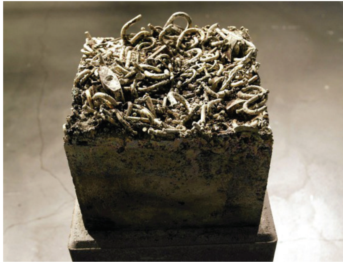
RAKKAUSLUKOT One Love, 2012

1 Helsingin Sanomat (19.6.2012) ”Tampereen rakastavaiset raivostuivat lemmenlukkujen sulattamisesta” Jukka Harju