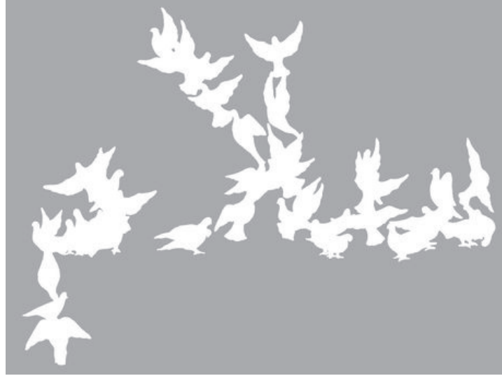
NO SALAAM, NO SHALOM Juho Viitala, 2011

Juho Viitalan teos "No salaam, no shalom" ehti saada luvan Tampereen kaupungilta, kunnes lupa evättiin kun teoksen sisällön tarkoituksiperät ymmärrettiin paremmin ja sen kriittinen näkökulma Patriaan olisi voinut saattaa kaupungin vaikeaan asemaan. Kyseessä oli poliittinen teos, jolla Viitala halusi kommentoida apartheidin tunnusmerkit täyttävää Israel-Palestiina -konfliktia sekä suomalaisten yritysten, lähinnä Patrian, käymää asekauppaa Israelin kanssa. Viitala olisi tehnyt tämän maalaamalla Tampereen keskustassa katuun parven valkoisia kyyhkysiä, jotka olisivat muodostaneet arabiankielisen sanan "salaam" (suom. rauha). Tampereen kaupunki ei halunnut aiheuttaa välien kiristymistä suuren Suomalaisen asevalmistajayrityksen kanssa.