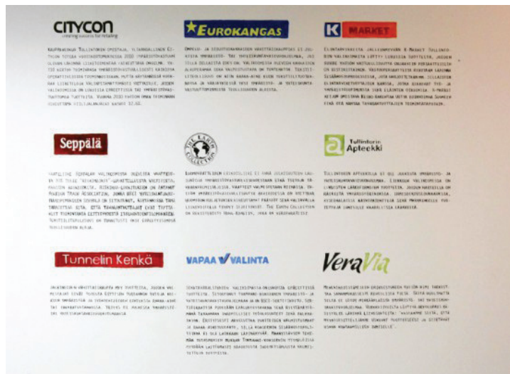
TIEDOSTAVAN KULUTTAJAN SYNNINPÄÄSTÖ Teemu Takalo, 2011