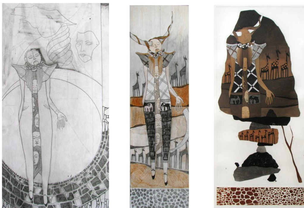
Kuva muotoutuu useiden eri luonnosten kautta lopulliseksi teokseksi.

Piirtäminen on niin kokonaisvaltaista, että siihen tempautuu mukaan koko ruumiillan ja hengellään; kun käsi piirtää viivan, mieli luo sille tarkoituksen ja muistikuvat saattavat sen jo tuttuihin, olemassa oleviin muotoihin. Näin luonnostelu jatkuu, viivat alkavat elää, johtavat johonkin, mutkittelevat ja ehtyessään ne hautautuvat muihin viivoihin muodostaen kokonaisen kuvan. Lopuksi on mahdotonta sanoa kumpi tuli ensin, luonnos vai idea.