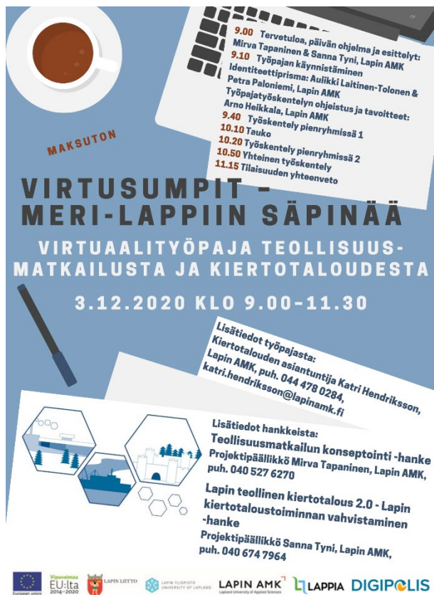
Kuva 3. Virtusumpit työpajan kutsu ja ohjelma