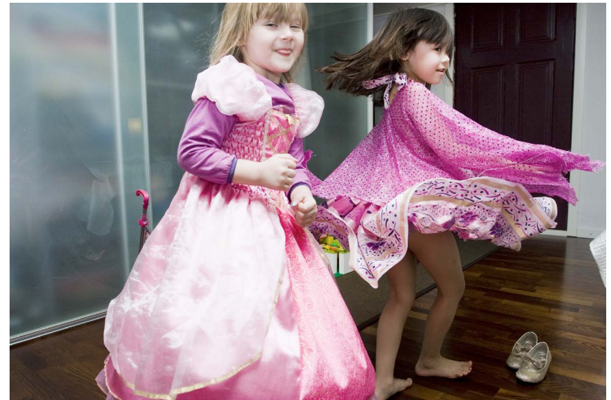
Viivi ja Mari tanssivat Barbie-elokuvan inspiroimina.

Opinnäytetyöseminaareissa käymieni keskustelujen myötä