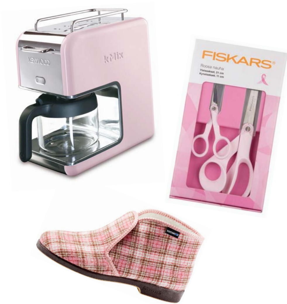
Pinkkinä voi ostaa esimerkiksi kahvinkeitin, Reino-tossut tai Fiskarsin sakset.