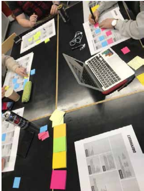
Idéutvecklingen skedde under tiden då alla deltagare ännu kunde samlas runt samma bord.