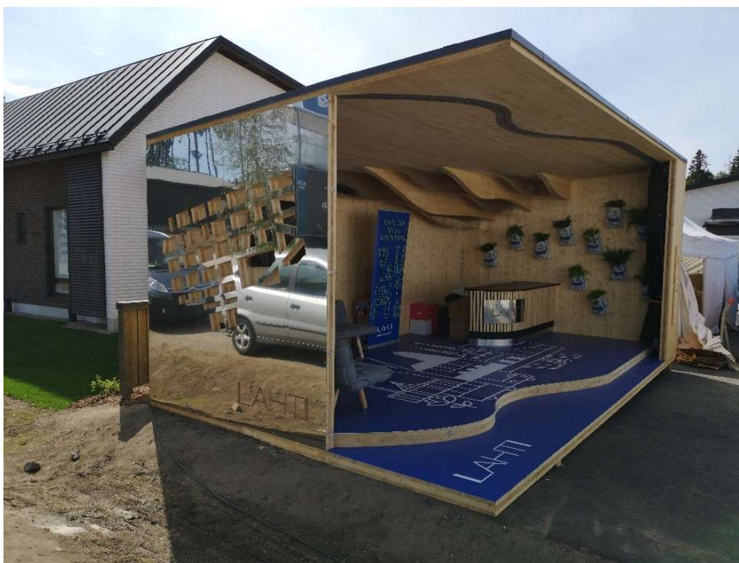
Kuva 1. Lahden toimipisteenä Kouvolan asuntomessuilla 2019 toiminut paviljonki

Souvin liikevaihto vuonna 2019 oli 46000€, josta valtaosa tuli kevytyrittäjäpalvelun kautta. Muu liikevaihto tuli Souvin tekemistä opiskelijaprojekteista. Merkittävin opiskelijaprojekti oli Lahden kaupungin tilauksesta valmistettu paviljonki (kuva 1), joka toimi Lahden kaupungin toimipisteenä Kouvolan asuntomessuilla.