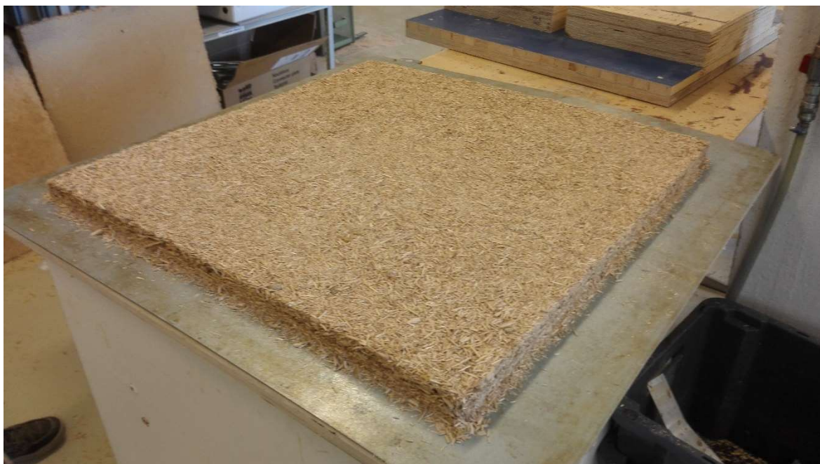
Kuva 2. Lastulevyn liimaan sekoitetut lastut annosteltu ja tasattu ennen lopulliseen paksuuteen puristusta.