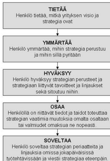
Kuvio 3. Strategia käytäntöön