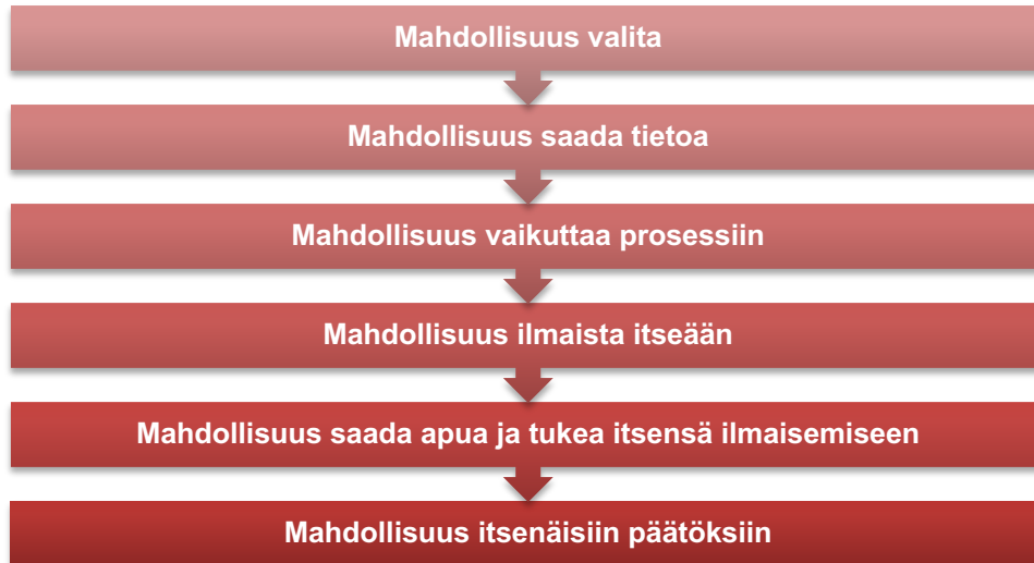
Kuvio 1. Osallisuuden ulottuvuudet (Thomas & Campling 2002, 176).

sisältää lapsen mahdollisuudet vaikuttaa prosessiin, kuten siihen, mitä asioita esimerkiksi tapaamisessa käsitellään. Neljäs ulottuvuus sisältää lapsen mahdollisuudet ilmaista omia näkemyksiään. Viidennes ulottuvuus käsittelee lapsen mahdollisuuksia saada tukea itsensä ilmaisemiseen, mikäli asia on vaikea muotoilla siten, että lapsen näkemys välittyy eteenpäin. Kuudes ulottuvuus on lapsen mahdollisuudet tehdä itsenäisiä päätöksiä. (Thomas & Campling 2002, 176.)