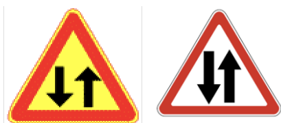
Kuva 3. Kaksisuuntainen liikenne