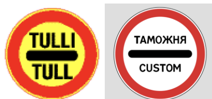
Kuva 4. Pakollinen pysäyttäminen tullitarkastusta varten

Wienissä 8.11.1968 tehtiin tieliikennettä koskeva yleissopimus, jonka Suomi ratifioi 15.2.1985 ja joka tuli voimaan 1.8.1986 (Tieliikennettä koskeva Wienin yleissopimus 1986, 1. §). Neuvostoliitto allekirjoitti ja ratifioi sopimuksen vuonna 1974 (Vienna Convention on Road Traffic/8.11.1968). Venäjä Neuvostoliiton valtioseuraajana liittyi Wienin tieliikenteen yleissopimukseen vuonna 1993 (Venäjän federaation perustuslaki 1993, 67.1. §).