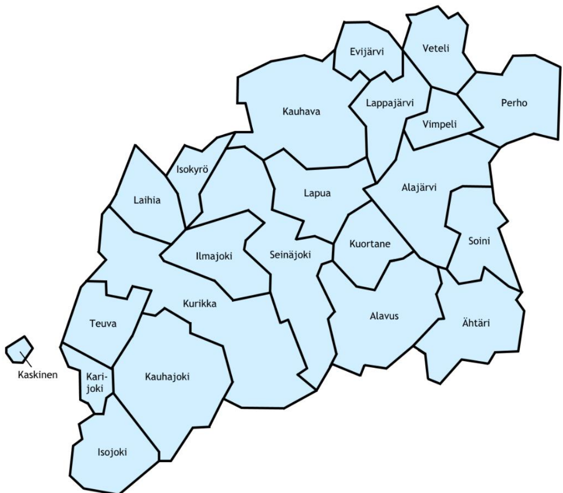
Kuva 1. EEPOS-Kirjastojen kunnat. (EEPOS, [viitattu 25.11.2019]).

Tarkemmin alueet, jotka kuuluvat EEPOS-kirjastoihin, ovat Alajärvi, Alavus, Evijärvi, Ilmajoki, Isojoki, Karijoki, Kauhajoki, Kauhava, Kuortane, Lappajärvi, Lapua, Seinäjoki, Soini, Teuva, Vimpeli, Ähtäri, Isokyrö, Laihia, Veteli, Perho ja Kaskinen (EEPOS, [viitattu 15.2.2020]).