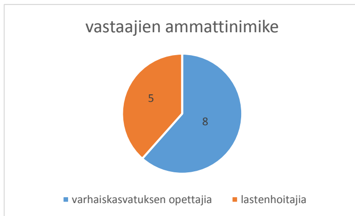
Kuvio 2: Vastaajien ammattinimikkeet

Vastaajista kaikki ovat työskennelleet alle 3- vuotiaiden ryhmässä. Kolme vastaajista on työskennellyt yli 15 vuotta alle 3- vuotiaiden ryhmässä, kaksi on työskennellyt 10-15 vuotta alle 3- vuotiaiden ryhmässä, kuusi on työskennellyt 5-10 vuotta alle 3- vuotiaiden ryhmässä ja kaksi vastaajista on työskennellyt alle 5 vuotta alle 3- vuotiaiden ryhmässä.