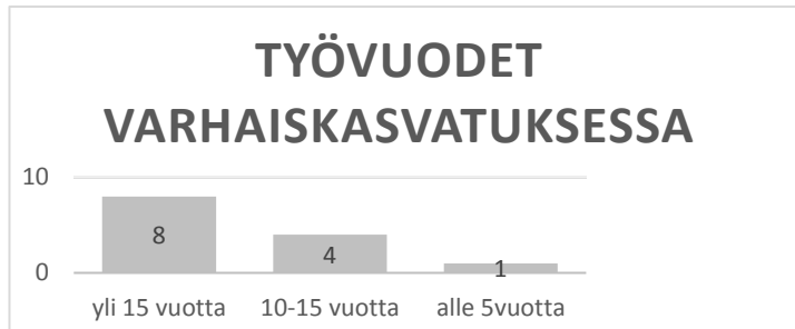
Kuvio 1: Vastaajien työvuodet varhaiskasvatuksessa

työskennellyt alle 5 vuotta varhaiskasvatuksessa. Vastaajista varhaiskasvatuksen opettajia oli kahdeksan ja lastenhoitajia viisi.