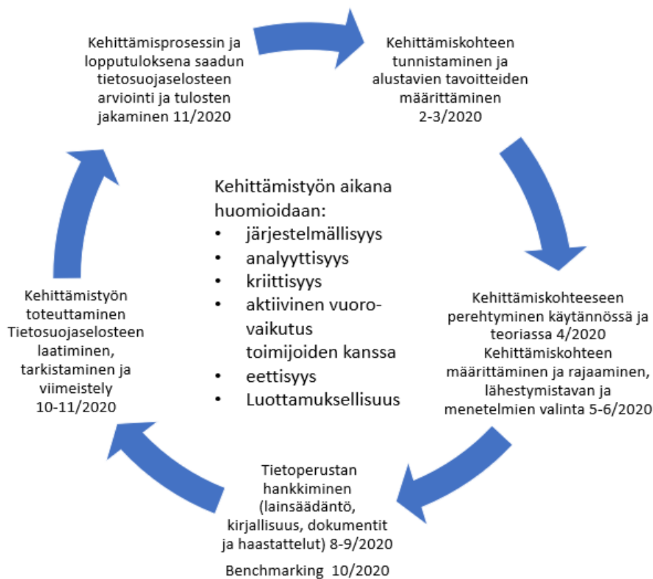
Kuvio 3. Kehittämisprosessin vaiheet

(Ojasalo ym. 2015, 18–24). Niin tapahtui myös tässäkin prosessissa. Kuviossa 3 olen havainnollistanut pääpiirteittäin kehittämisprosessin eri vaiheet ajankohtineen.