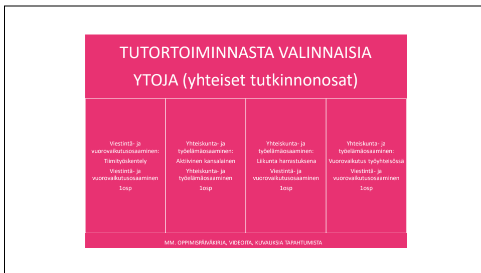
Kuva 1. Tutortoiminnasta valinnaisia ytoja

Lehtori laati näistä valikoiduista aineista kurssipohjan itslearning oppimisym- päristöön. Ja sinne koottiin eri opettajilta tehtäviä, jotka olisivat mahdollista tu- tortoiminnassa toteuttaa. Itse laadin tätä tutoreille selkeyttämään kaavion (kuva1), jotta heidän olisi helpompi hahmottaa miten ja mistä osaamispisteitä on mahdollista kerryttää.