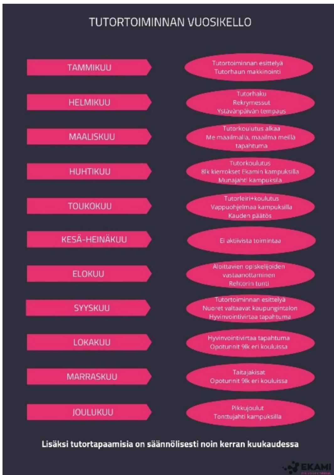
Kuva 2. Tutortoiminnan vuosikello