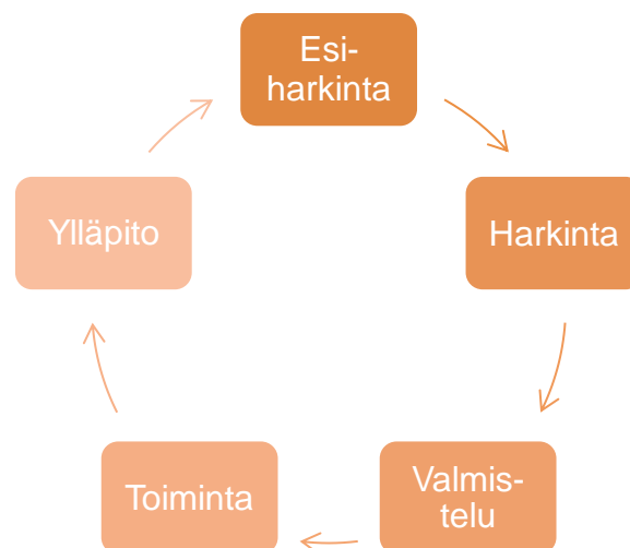
Kuvio 2. Muutoksen vaihemalli. (Mukaellen: Prochaska, DiClemente & Norcross, 1992.)