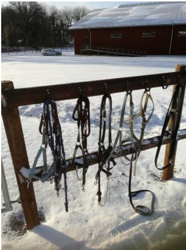
Pihattohevoset jättivät riimunsa naulakkoon.