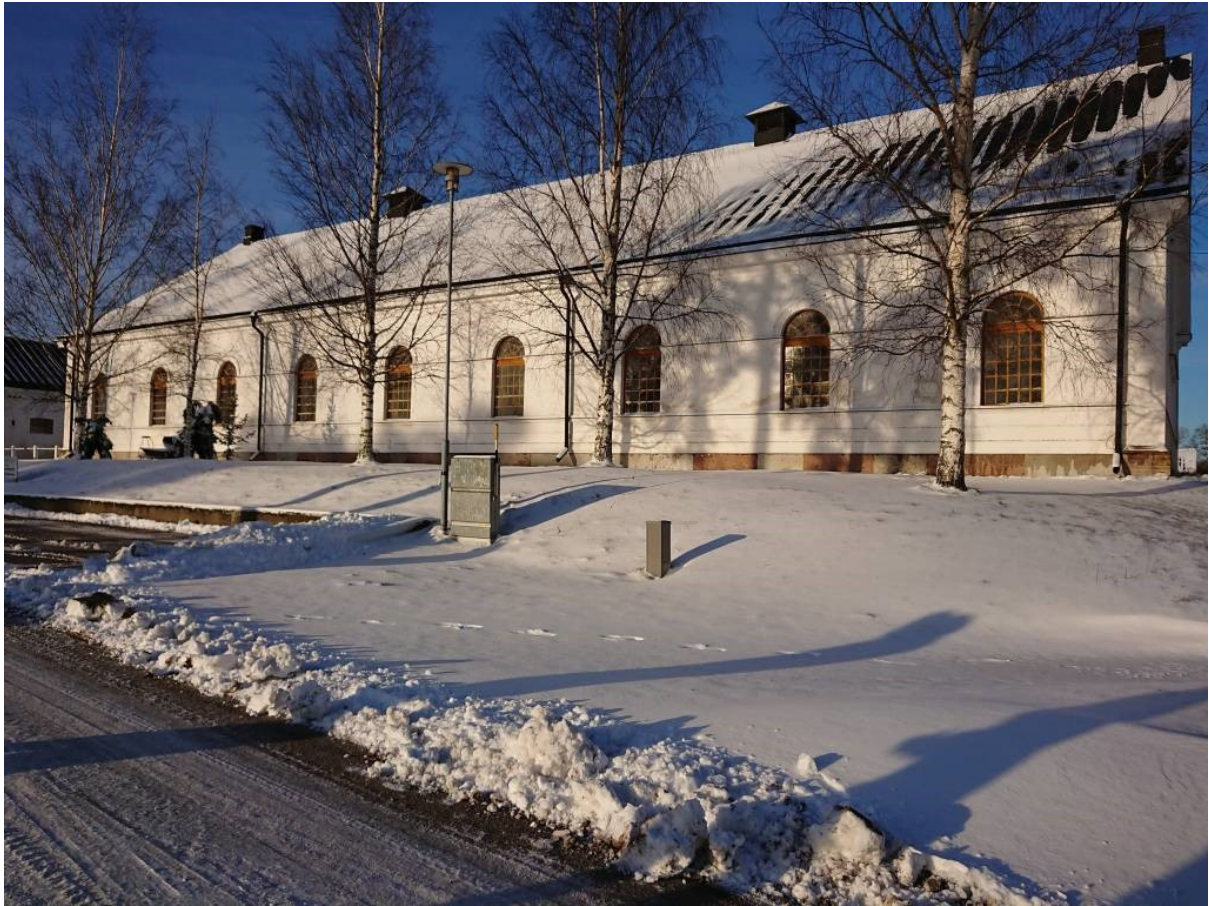
Strömsholman kaunis Valkoinen maneesi ulkoa ja sisältä.