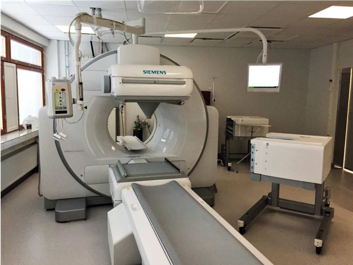
KUVA 1. Gammakameran ja TT-laitteen yhdistelmä

Bioanalytiikan tutkintoon sisältyvät isotooppi- eli gammakuvaukset, joten niitä bioanalyttikko saa tehdä isotooppiasastolla [9]. Toiminnanharjoittaja ja lääketieteellisestä altistuksesta vastaava lääkäri voivat valtuuttaa asianmukaisen täydennyskoulutuksen saaneen isotooppikuvantamiseen perehtyneen muun terveydenhuollon ammattihenkilön kuin röntgenhoitajan, suorittamaan isotooppilääketieteen yhdistelmälaitteella tehtävän ennalta määritellyn vakio-ohjelman mukaisen natiivitietokonetomografiatutkimuksen, jos tutkimus on kiinteä osa isotooppikuvantamista. [6] [10] Tällaista täydennyskoulutusta ei ole tarjolla, mutta esimerkiksi bioanalyttikko voisi suorittaa radiografian ja sädehoidon tutkinto-ohjelmasta opintoja, kuten säteilyfysiikka, tietokonetomografian perusteet, säteilysuojelun optimointi [10], joilla hän saavuttaa tarvittavan osaamistason. (Kuva 1.)