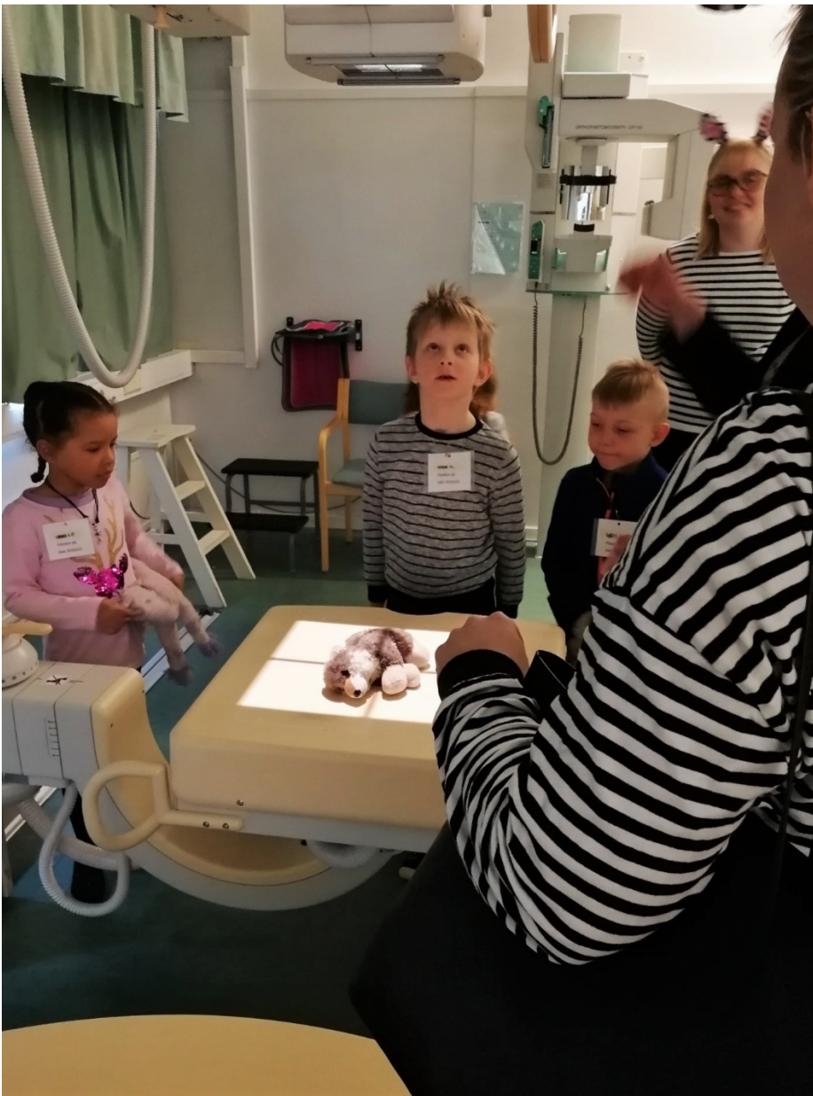
KUVA 3. Röntgenhoitajaopiskelijat ja vierailulla olleita lapsia asettelemassa nallea natiivikuvausta varten

Röntgenhoitajan tutkintoon sisältyy kaikkien lääketieteellisen altistuksen eri osa-alueiden osaamisvaatimukset täyttävä osaaminen niin röntgendiagnostiikan kuin isotooppiutkimusten ja sädehoitojen osalta samoin kuin säteilyturvallisuusvastaavan teoreettinen osaaminen. Säteilyfysiikka kattaa laajasti niin röntgenfysiikan, radioaktiivisten aineiden kuin sädehoidon eri kuvantamis- ja sädehoitomenetelmien fysikaaliset perusteet. Erilaisten kuvantamis- ja hoitolaitteiden rakenne ja toiminta ja laadunvarmistus on ymmärrettävä, jotta niitä voi käyttää turvallisesti, ja erityisesti säteilyturvallisuus huomioiden. Potilaan, henkilökunnan ja mahdollisen tukihenkilön säteilysuojelun optimointi kuvantamis- ja hoitotilanteissa on röntgenhoitajan työn ydinosaa. Näitä tietoja ja taitoja röntgenhoitaja harjoittelee kaikilla kuvantamis- ja hoitomenetelmillä koulutuksen aikana niin simuloinneissa kuin kliinisessä työssä. (Kuvat 3 ja 4.) [10]