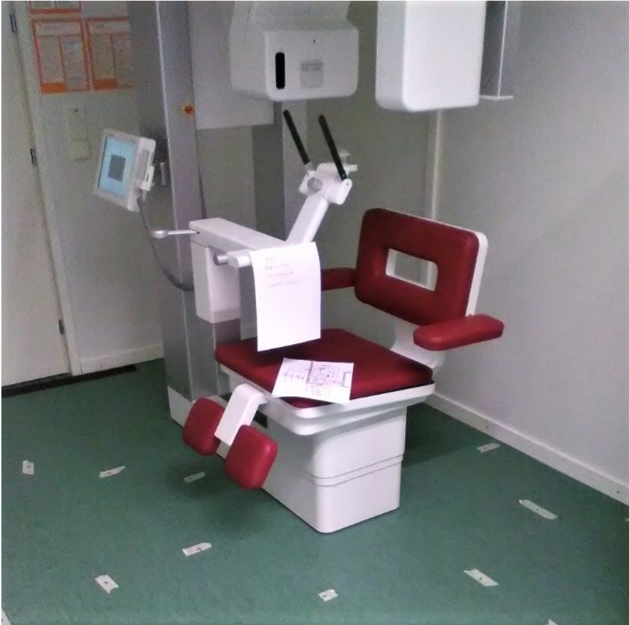
KUVA 7. Säteilyn sironnan mittaamispisteet kartiokeila laitteen ympärillä