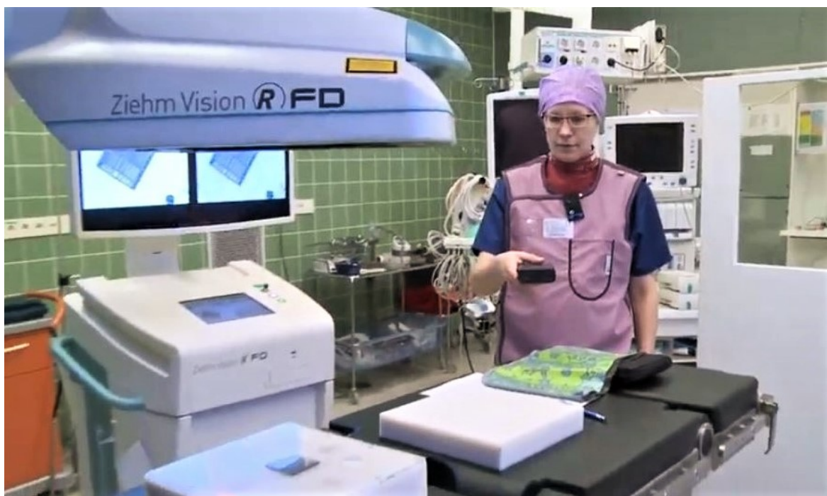
KUVA 5. Säteilyn sirontan demonstroiminen leikkaussalissa

Oamkilla toteutettavissa on demonstraatio Oamkin röntgensimulaatiotiloissa oikean toimivan C-kaaren äärellä tai avoimen ammattikorkeakoulun kautta tuleville heidän omilla työpaikoillaan leikkaussalissa tai poliklinikalla. Näissä tilanteissa käydään läpi kaikki C-kaaren toiminnot ja havainnoidaan säteilyn sirontaa eri tilanteissa lyijykumisuojaan pukeutuneina. Raskaana oleva ei voi osallistua demonstraatioon. Opiskelija suorittaa kirjallisen kuulustelun, josta hän saa erillisen todistuksen STUKin diaarinumerolla varustettuna. Toivottavasti tätä mahdollisuutta tuodaan esille hoitotyön opiskelijoille Oamkissa, mutta etenkin niissä ammattikorkeakouluissa, joissa ei ole röntgenhoitajan tutkinto-ohjelmaa. Mikäli valmistuvalla sairaanhoitajalla ei ole säteilysuojelukoulutusta perusopinnoissa, hän ei voi olla säteilylle altistavaa työtä tekevä. (Kuva 5.)