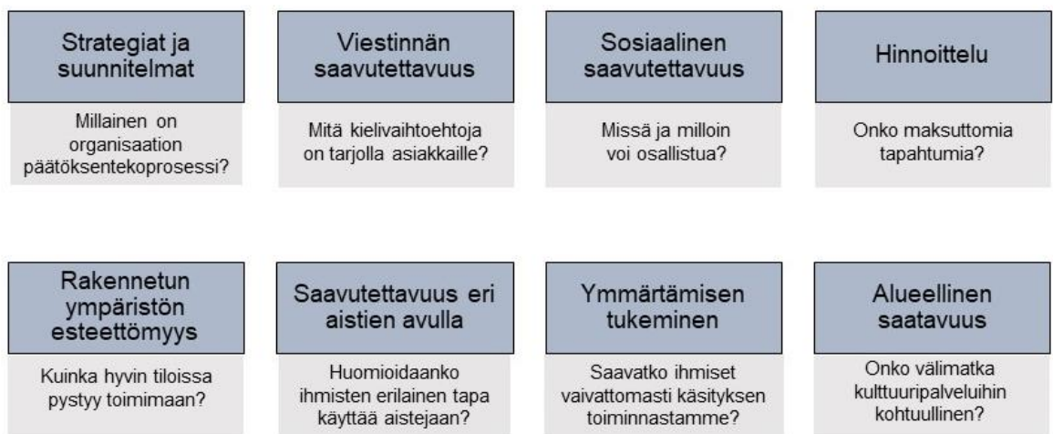
Kuvio 3. Kulttuurin saavutettavuus (Mitä on saavutettavuus? 2020).

Alueellinen saavutettavuus käsittää ajatuksen kulttuuripalveluiden tasa-arvoisesta saatavuudesta alueellisesti. Valtakunnallisesti kulttuuritarjonta saattaa alueittain vaihdella suuresti. Alueilla, joissa esimerkiksi kirjasto tai museo sijaitsee kauempana, tulee huomioida myös se, pääseekö julkisilla kuljetusvälineillä paikanpäälle helposti ja onko välimatka kulttuuripalveluihin kohtuullinen. (Alueellinen saatavuus 2020.) Alueellinen saavutettavuus liittyy erityisesti siihen, miten taide- ja kulttuuripalvelut ovat saavutettavissa eri puolilla maata. Kuitenkin myös palveluiden alueellinen saatavuus eri asuinalueilla kaupungin sisällä vaatii huomiota varsinkin isommissa kaupungeissa.