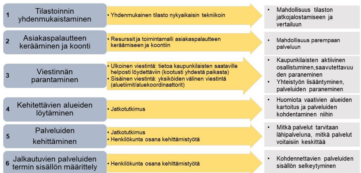
Kuvio 4. Kehittämissuhteet.