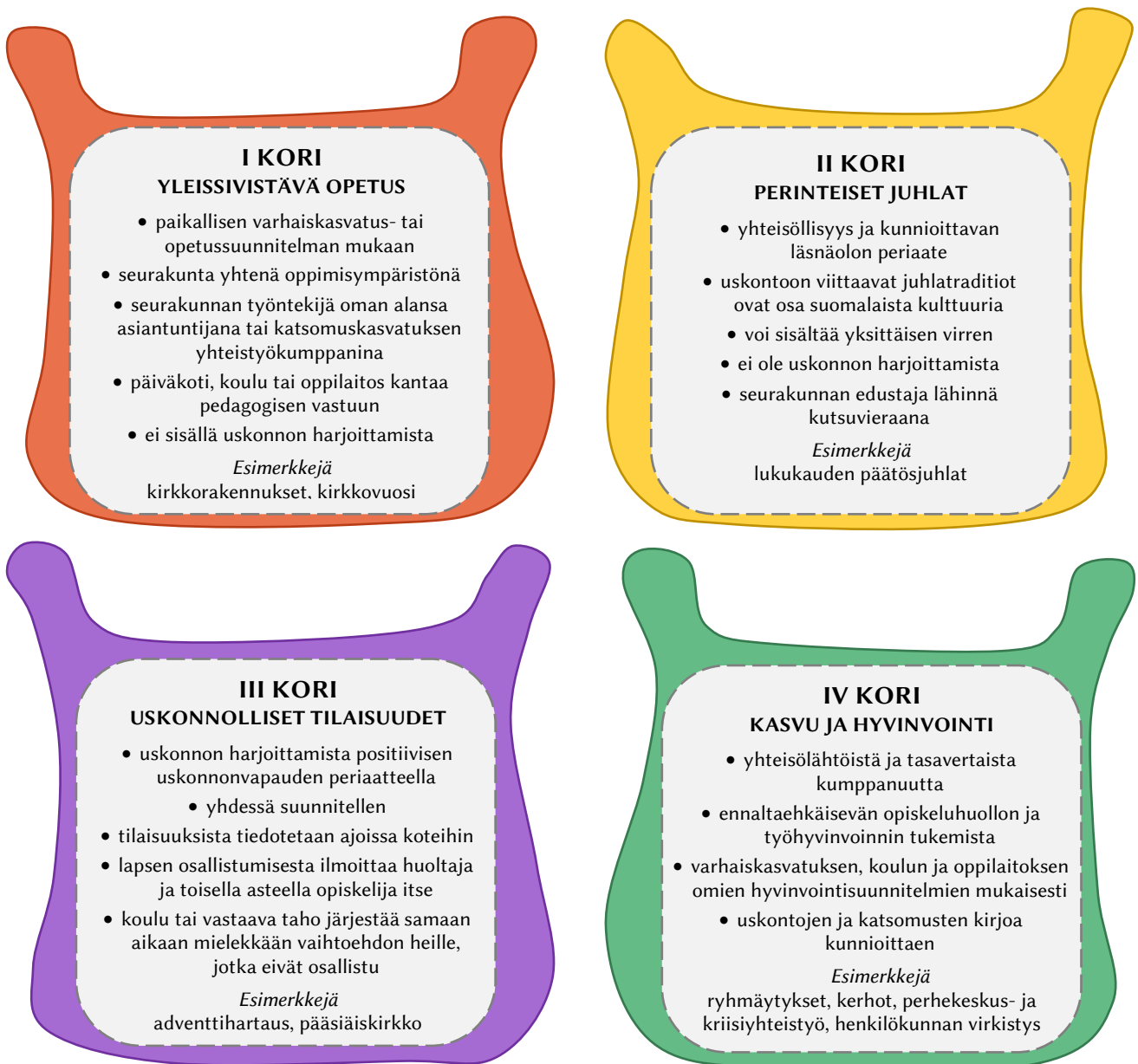
KUVA 1. Kumppanuuden korit (mukailien Suomen evankelis-luterilainen kirkko 2020b)

Kumppanuuden korien (KUVA 1) avulla kerrotaan seurakunnan ja varhaiskasvatuksen välisestä yhteistyöstä ja periaatteista, jotka perustuvat Opetushallituksen päivitettyihin ohjeisiin. Niillä pyritään takaamaan uskonnonvapauden toteutuminen niin varhaiskasvatuksessa kuin koulussakin. Yhdessä Varhaiskasvatussuunnitelman perusteet -asiakirjan kanssa Kumppanuuden korit suuntaavat monipuolisen yhteistyön muotoja ja luonnetta. Selkeät ja yhteiset toimintaperiaatteet vapauttavat toimimaan ja kehittämään yhteistyötä kaikkia kunnioittavalla tavalla. Varhaiskasvatuksen näkökulmasta keskeisimmät korit ovat Yleissivistävä opetus ja Kasvun ja hyvinvoinnin tuki. (Suomen evankelis-luterilainen kirkko 2020a.)