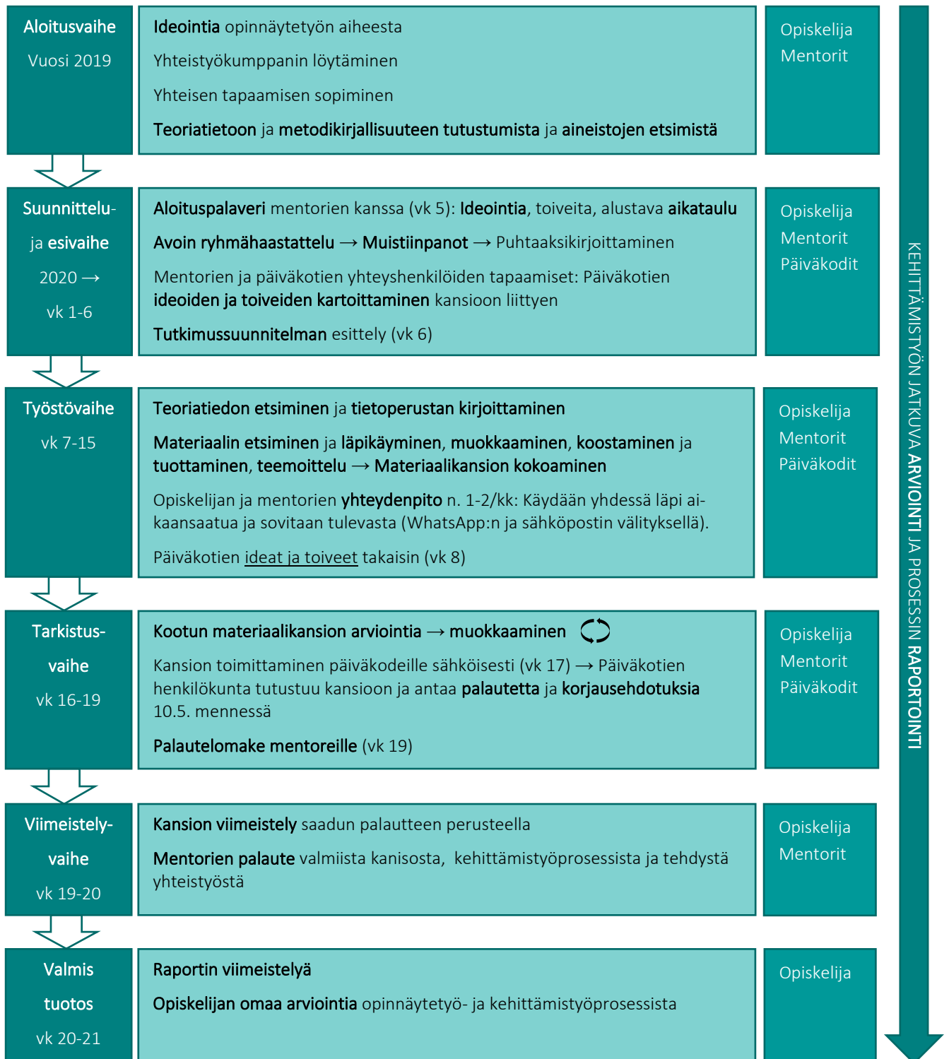
KUVIO 1. Kehittämistyön prosessin kuvaus

Oman kehittämistyöni prosessin vaiheet on esitetty kuviossa 1 (KUVIO 1). Kuten kuvioista käykin ilmi, osa prosessin vaiheista tapahtui myös päällekkäisinä. Kuviossa on nähtävissä kehittämistyön aikataulu, eri vaiheissa mukana olleet toimijat ja käytetyt menetelmät.