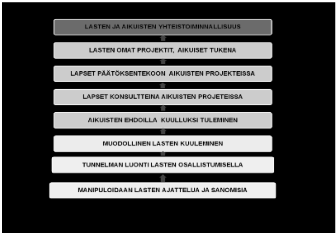
Kuvio 1 – Lasten osallisuuden portaat Hartin (1992) mallin mukaan (vapaa suomennos) (Turja 2011, 27.)

Tämä tikapuumalli selkeyttää osallisuuden eri tasoja hierarkkisesti ja tuo esille erityisesti ne tasot, jotka eivät ole aitoa osallisuutta. (Hart 1992, 8-9; Venninen, Leinonen & Ojala 2010, 9.)