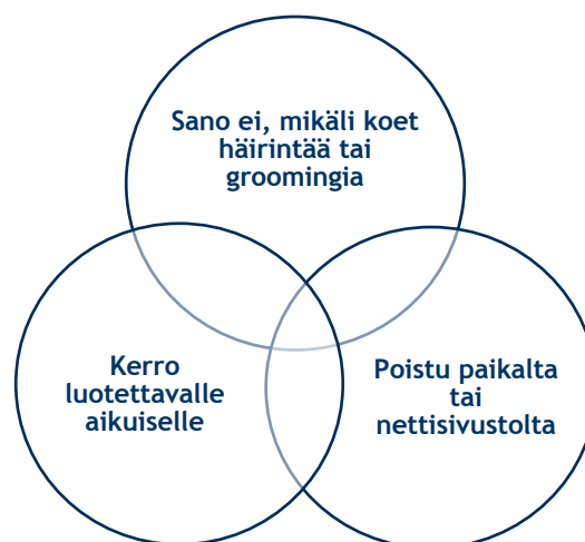
Kuvio 2. Turvataitojen perusteet (Mukaillen Aaltonen 2012, 16.)