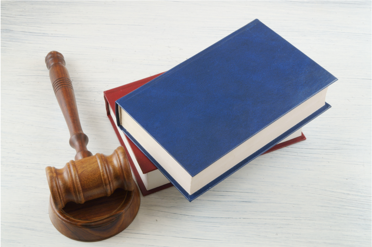
KUVA 2. Huumeestausta säätelevät voimassa olevat Suomen lait ja asetukset sekä niiden pohjalta luodut ohjeistukset

Huumeestauksessa luotettavuuden kannalta on tärkeää tarkastella koko prosessia aina näytteenottopaikasta varmennetun tuloksen tulkintaan. Huumeestauksia suorittavat aiheeseen perehdytetyt terveydenhuollon ammattihenkilöt, joilla tulee olla dokumentoitu perehdytys huumeestauksen näytteenottoon. Näytteenottajan tulee varmistaa testattavan henkilöllisyys. Lisäksi hänen tulee selvittää, onko kyseessä valvottava vai normaali näytteenotto ja minimoida näytteen manipulointimahdollisuudet. Näytteenottotilojen tulee olla asianmukaiset ja näytteiden käsittely on suoritettava niin, etteivät eri näytteet voi sekoittua, niitä ei voi väärentää, eikä niihin voi joutua epäpuhtauksia. Näytteiden tulee olla jäljitettävissä ja säilyä myös mahdollisen kuljetuksen ajan koskemattomana luotettavan tuloksen saamiseksi. Luotettavien huumeestaustulosten varmistamiseksi myös laboratorioihin kohdistuu tiettyjä kriteereitä. Kaikkien varmennetutkimuksia tekevien laboratorioiden tulee olla akkreditoituja ja varmennetustien tulee kuulua akkreditoinnin pätevyysalueeseen. Myös useimmat ensivaiheen immunologisia huumeestauksia tekevät laboratoriot ovat akkreditoituja eli niiden pätevyys on todettu menettelytavalla, joka on kansainvälisiin kriteereihin perustuva. Laboratoriot noudattavat yleisiä laadunhallintaan liittyviä periaatteita ensivaiheen huumeestauksessa. [15] [16] [17]