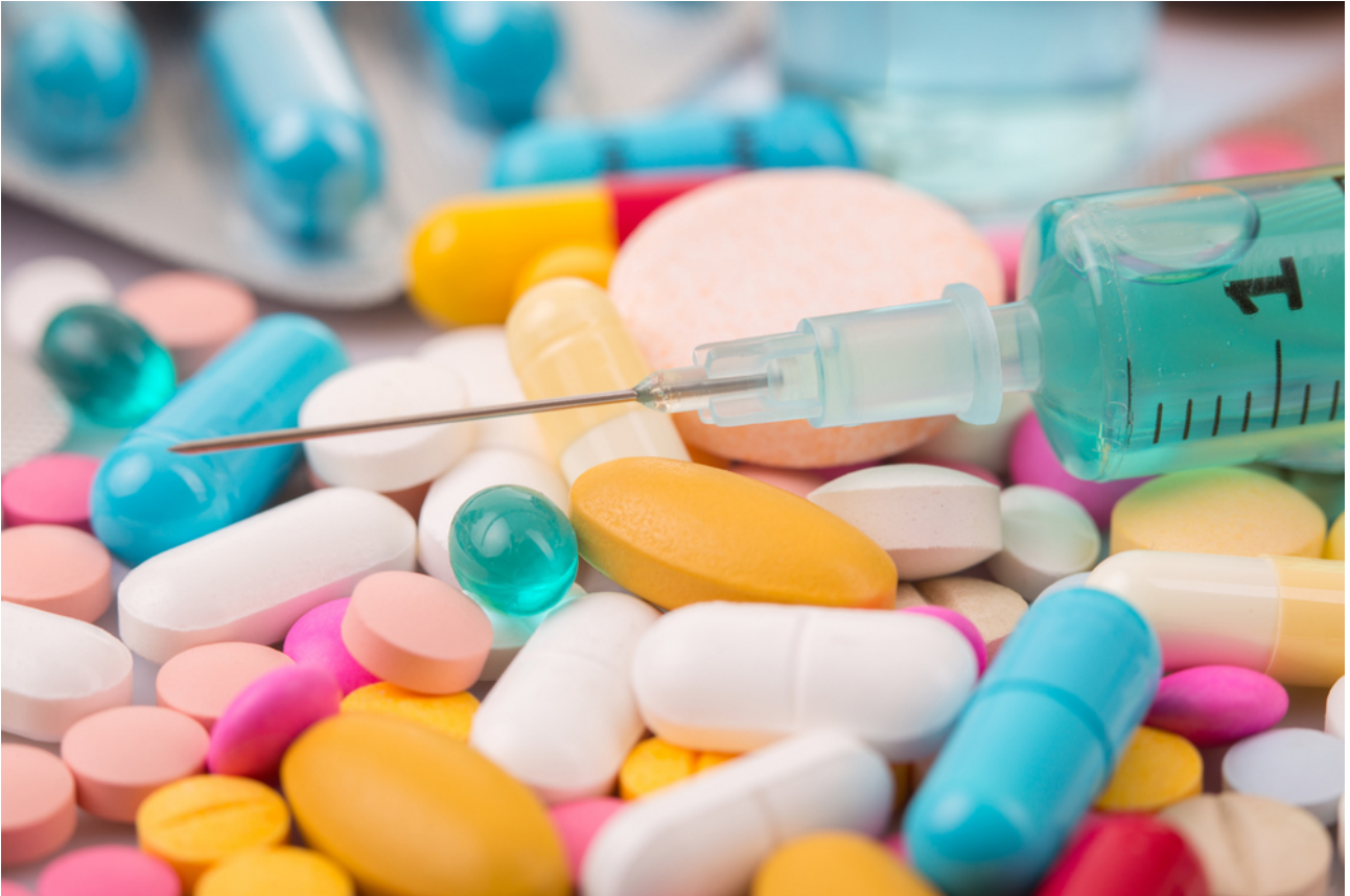
KUVA 1. Huumeiden käyttö on Suomessa laissa kiellettyä, mutta huumeiden käyttäjilläkin on oikeus laadukkaaseen terveyden- ja sairaanhoitoon

Potilaan asemasta ja oikeuksista annettu laki (785/1992) määrää, että potilasta on kohdeltava hänen ihmisarvoaan loukkaamatta ja hänen vakaumustaan ja yksityisyyttään kunnioittaen. Huumetestauksen syy ja seuraukset on käytävä perusteellisesti läpi testattavan kanssa ja kaikkiin esille tuleviin kysymyksiin pitää vastata. Asianomaisen täytyy ymmärtää, mitä positiivinen huumetestaustulos voi hänelle aiheuttaa. Terveystieteiden ammattihenkilön pitää kirjata potilasasiakirjoihin hoidon ja seurannan turvaamiseksi tarpeelliset tiedot. Kaikki potilasasiakirjoissa esitetyt asiat ovat salassapidettäviä. Potilastietojen jakamiseen tarvitaan potilaan kirjallinen suostumus. Salassapitovelvollisuuden rikkomisesta tuomitaan rikoslain 38 luvun 1. ja 2§:n mukaan. Laki potilaan asemasta ja oikeuksista 17.8.1992/785, 2 § määrittää, että valtakunnallinen sosiaali- ja terveysalan eettinen neuvottelukunta käsittelee esimerkiksi potilaan ja asiakkaan asemaan liittyviä eettisiä kysymyksiä ja antaa niistä suosituksia. Lain mukaan jokaisella Suomessa pysyvästi asuvalla on oikeus ilman syrjintää saada tarvitsemaansa terveyden- ja sairaanhoitoa turvallisesti ja suunnitellusti. [1] [10] [11] [12] [13]