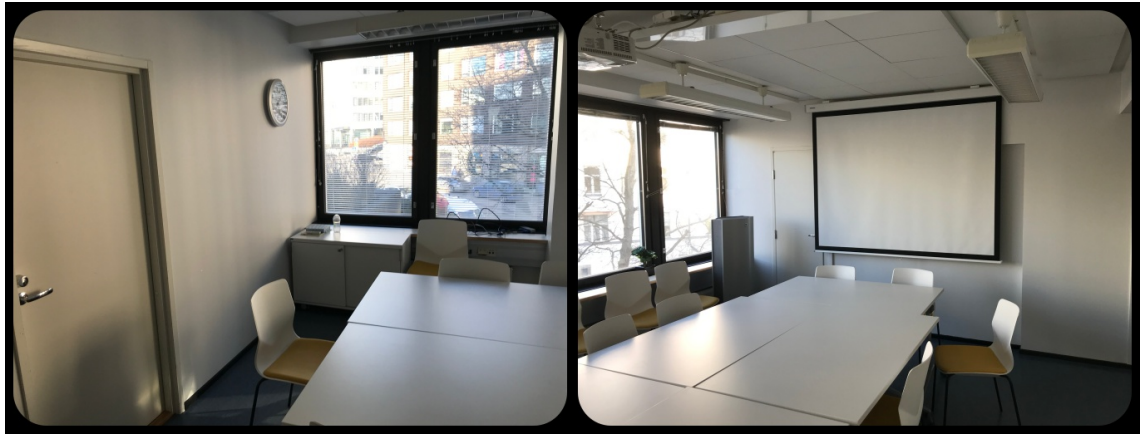
Kuva 4. Kolmannen muskarin tilana toiminut kokousshuone ennen muskaria.

Koska kaksi ensimmäistä kertaa olivat olleet hyvin erilaisia, odotin mielenkiinnolla mitä tällä tunnilla tulisi tapahtumaan. Pidin tunnin rakenteen kaikesta huolimatta hyvin samanalaisena kuin edellisilläkin kerroilla. Päätin kuitenkin kokeilla panostaa erityisesti tunnin loppupuolella oleviin rauhallisempiin hetkiin ja loppurentoutukseen. Ajatuksena oli kokeilla, että mikäli meno yltyisi taas kovin villiksi, voisimmeko saada musiikillisilla työtoivoilla tunnelman myös rauhoitettua.