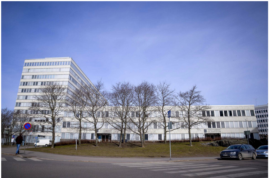
Kuva 1. Kallion perhekeskus.

Perhekeskuksissa eri alojen työntekijät tekevät tiiviisti yhteistyötä, jolla pyritään verkostoimaan aiemmin erillään olleita palveluita (Terveyden ja hyvinvoinnin laitos 2020). Helsingin kaupungin nettisivuilla olevassa ”Kallion uusi perhekeskus avattiin” -artikkelissa annetaan aiheesta käytännön esimerkki; jos olisi esimerkiksi tilanne, että terveydenhoitaja huomaisi perheen hyötyvän moniammatillisesta yhteistyöstä, voitaisiin mukaan rinkiin tuoda vaikka sosiaalityöntekijä, psykologi ja toimintaterapeutti. Perhekeskusten toimintatavan taustalla oleva ajatus on nimenomaan ennalta ehkäistä varsinaisten ongelmien syntymistä. (Hel.fi 2019.)