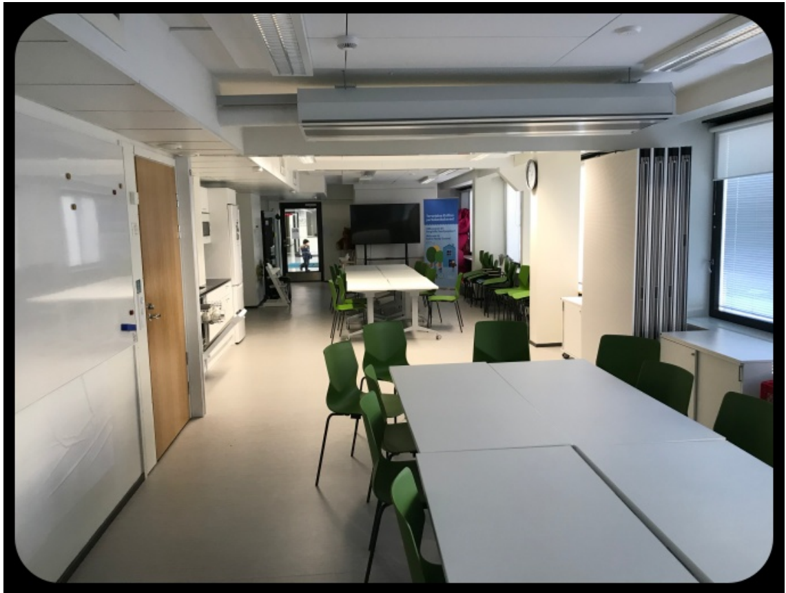
Kuva 2. Kallion perhekeskuksen perhekahvila.

siaalihjaajilta ennen tunnin alkua, ettei osallistuvista perheistä kukaan ollut aiemmin ollut muskarissa. Harvalla heistä oli ylipäänsä minkäänlaista kokemusta ryhmätoiminnassa mukana olemisesta, johon sekä lapset että vanhemmat osallistuvat.