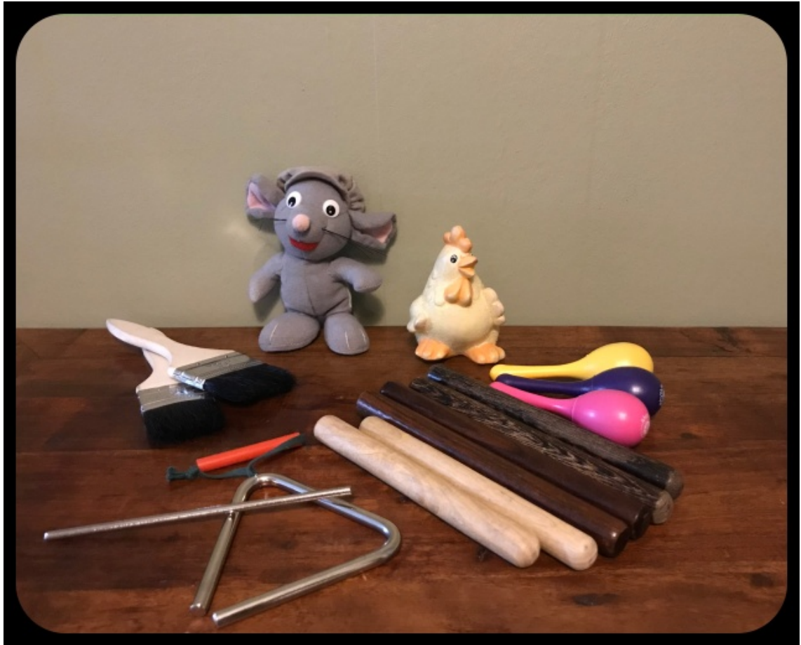
Kuva 3. Muskaritunneilla käyttämiäni soittimia ja muuta välineistöä.

Pian tämän jälkeen oli vuorossa piirileikki. Piirileikin taustalla tällä tunnilla käytin Lastenmusiikkiorkesteri Ammuun kappaletta ”Kaikki mukaan”. Tarkoituksena oli liikkua laulun tahdissa piirissä ja välillä pysähtyä tekemään laulun sanojen inspiroimia yksinkertaisia tanssiliikkeitä. Esimerkiksi, kun kappaleessa laulettiin lehmän sorkkatanssista, pysähdyttiin ja pyöriteltiin käsiä, hevosen harjatanssissa heiluteltiin hiuksia jne. Etenkin tässä leikissä lasten levottomuus oli erityisesti havaittavissa ja osa lapsista tekikin leikin aikana omia juttujaan. Se, että osa lapsista ei aina tehnyt laulun liikkeitä, hankaloitti myös vanhempien leikkiin heittäytymistä.