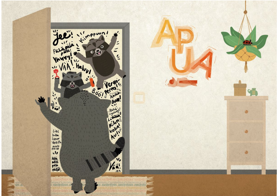
Kuva 2. Kuvitus omasta kirjastani. Vertin rauhallinen aamu keskeytyy pikkusisarten yllättävään hyökkäykseen.

Kirjailija Katri Tapola kertoo, että kirjoitusprosessi voi saada alkunsa mieltä vaivaavasta näystä, tunnelmasta tai kuvasta, josta on pakottavaa päästä kirjoittamaan (Helsingin kaupungin taidemuseo 2005, 73).