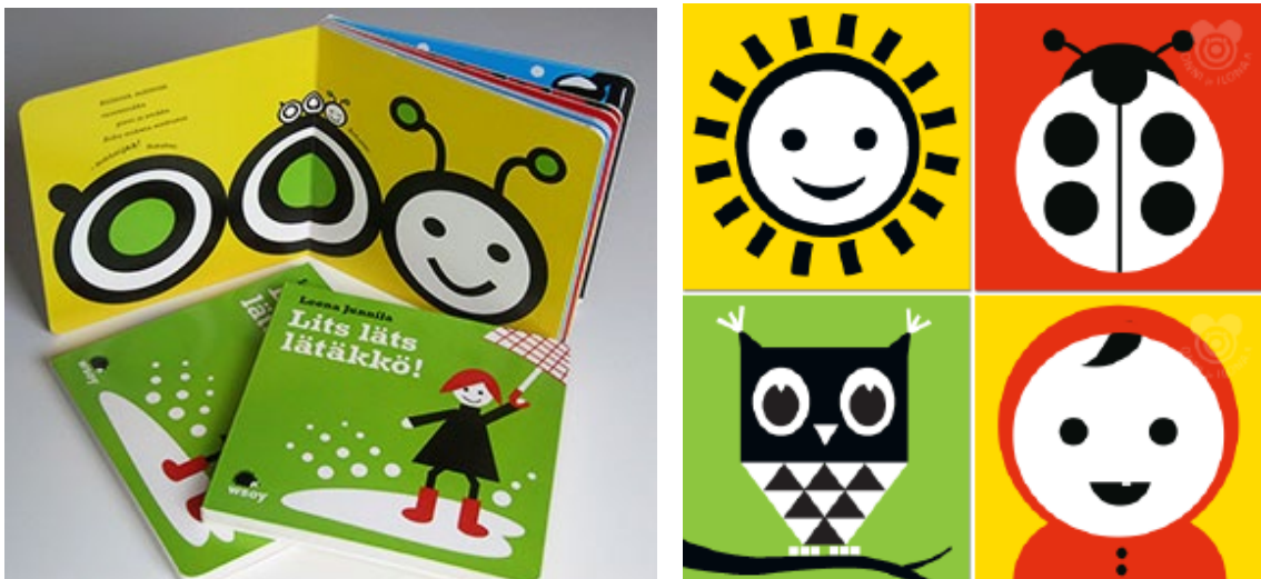
Kuva 11. Onni ja Ilona -tuotemerkin kirja Lits läts lätäkkö. (Onni ja Ilona / Junnila 2019)

Värikkäät ja ilmeikkäät kuvitukset herättävät lasten kiinnostuksen. Jo pienet vauvat jäävät tuijottamaan yksinkertaisia, graafisia kuvioita, joissa näkyy esimerkiksi hymyilevät kasvot. Esimerkiksi Onni ja Ilona -katselukortit ja -kirja ovat suunniteltu varta vasten vauvan katseen kehitystä ajatellen. Kuviot ja värit ovat hyvin selkeitä ja yksinkertaisia (Kuva 11 ja 12).