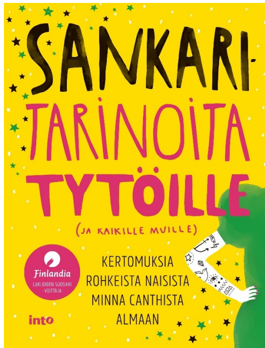
Kuva 21. Joulukuun 2018 kolmanneksi myydyin kirja lasten- ja nuortenkirjat -sarjassa. https://kauppa.intokustannus.fi/kirja/sankaritarinoita-tytoille-ja-kaikille-muille-kertomuksia-rohkeista-naisista-minna-canthista-almaan/