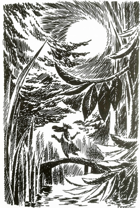
Kuva 5. Kansikuvitus novellista Hemuli joka rakasti hiljaisuutta (Jansson 1962, 87).