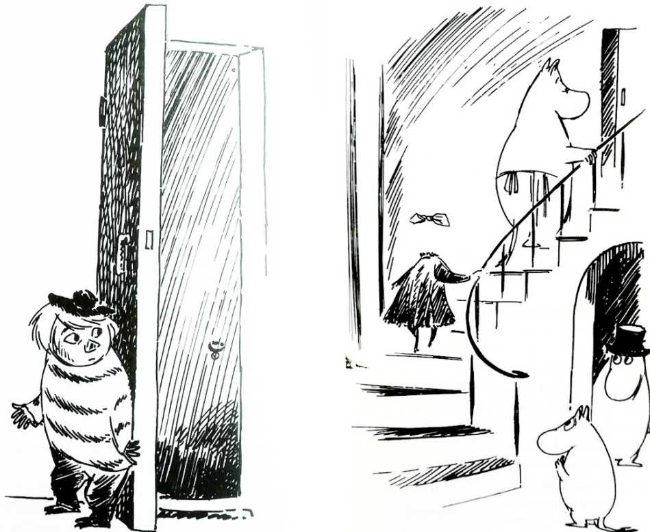
Kuva 8. Tuu-tikki päästää Ninnin sisälle Muumitaloon (Jansson 1962, 118).

Kuvitus tukee upeasti syvällistä tarinaa. Kun Tuu-tikki tuo Ninnin muumitaloon, hänestä näkyy vain kaulaan sidottu kulkunen (Kuva 8). Kuvituksessa Ninni saapuu valoisaan muumitaloon synkästä syysateesta. Kuva toimii vertauskuvallisena kerrontana tytön apeasta historiasta, josta hän on vihdoinkin astumassa pois. Satu ei ole kuitenkaan lohduton, sillä lopuksi muumitalon lempeä ympäristö saa Ninnin rohkaistumaan ja hän tulee vähitellen näkyviin (Kuva 9).