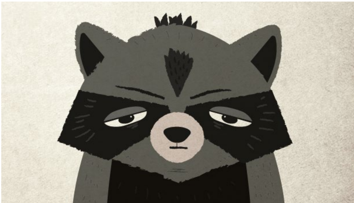
Kuva 1. Oman kirjani päähenkilö, Vertti.

Keskittän opinnäytetyössäni suurimman huomion kuvitukseen, sen ollessa omaa alaani läheisin aihealue. Näin ollen pyrin peilaamaan jokaista aihealuetta myös kuvittamiseen. Tutkimani tiedon tarkoituksena on tukea opinnäytetyöni produktiivista osaa, eli oman kuvakirjani aloittamista. Opinnäytetyön puitteissa suunnittelen ja toteutan viisi valmista aukeamaa omalle lasten kuvakirjalleni. Kuvitukset eivät ole peräkkäisiltä aukeamilta. Produktiivinen työ pitää sisällään myös kirjan kokonaiskonseptin rakentamista, eli tarinan, hahmojen ja kuvitustyylin suunnittelua. Näitä asioita käyn läpi kirjallisen opinnäytetyön edetessä. Kuvakirjan kohderyhmänä ovat karkeasti noin 4–8-vuotiaat lapset. Kirjan sanoman ja luonteen vuoksi se sopii kuitenkin hyvin monen ikäisille. Kirjan päähenkilö on pesukarhu nimeltä Vertti.