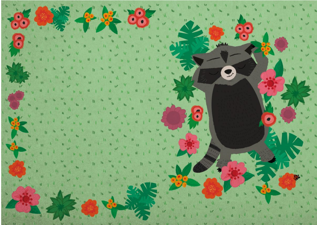
Kuva 10. Kuvitus omasta kirjasta. Vertti kokee myös onnellisia hetkiä.

hän nauttii ja hän on pohjimmiltaan onnellinen. Tällaisissa tilanteissa Vertin ilme muuttuu rentoutuneeksi ja iloiseksi ja kuvituksiin tulee lisää väriä (Kuva 10). Vertti tarvitsee välillä aikaa hiljaa latautumiseen, kun päivän hälinä on kuluttanut energiatasot olemattomiin.