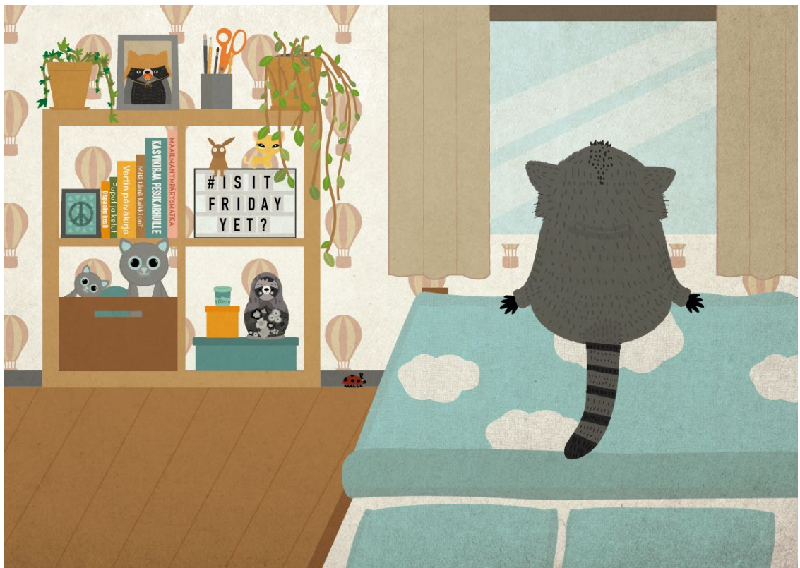
Kuva 13. Vertin huoneesta löytyy pieniä yksityiskohtia, joita lapsi voi tutkia.

Lapset rakastavat yllätyksiä, varsinkin kun yllätykset ovat itse löydettävissä. Oman kokemukseni mukaan iloisia yllätyksiä tuovat esimerkiksi tutut esineet, joita ei välttämättä odottanut löytyvän kirjasta. Tällaisia voivat olla esimerkiksi niinkin yksinkertaiset asiat, kuin tutun näköiset lelut, koriste-esineet tai astiat. Iloisena yllätyksenä voi tulla myös joka sivulla toistuva elementti, esimerkiksi sivuhahmo tai esine, jota ei edes mainita tarinassa.