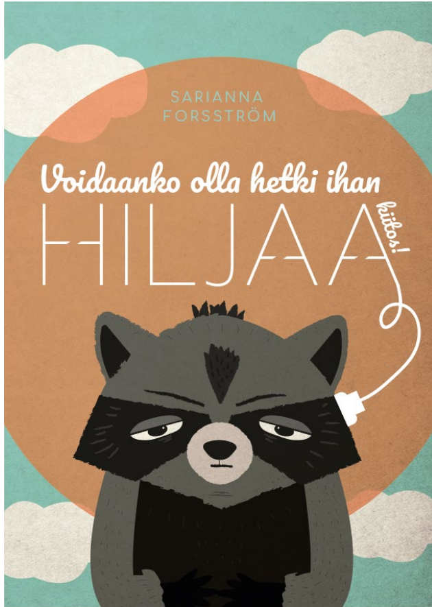
Kuva 7. Oman kirjani kannessa on päähenkilö Vertti.

Kirjani keskittyy Vertin päivän kulkuun ja muut hahmot ovat melko pienessä sivuosassa. Luonteeltaan Vertti on erityisherkkä tai introvertti, ehkä jopa molempia. Tätä on turha liian tiukasti rajata, sillä tärkein ominaisuus on melusta ja hälinästä uupuminen. Hän viihtyy parhaiten pienessä porukassa, kahdestaan tai yksikseen. Hän pitää hauskanpidosta ja villedistäkin leikeistä, mutta useat päällekkäiset äänet häiritsevät häntä suuresti. Luokkakavereiden on välillä vaikeaa ymmärtää, miksi hän on hiljainen ja vetäytyvä. Tämä johtuu kuitenkin vain siitä, että Vertti väsyä päivän aikana kokemistaan ärsykkeistä. Hän kaipaisi välillä aikaa itsekseen, ladatakseen energiatasojaan.