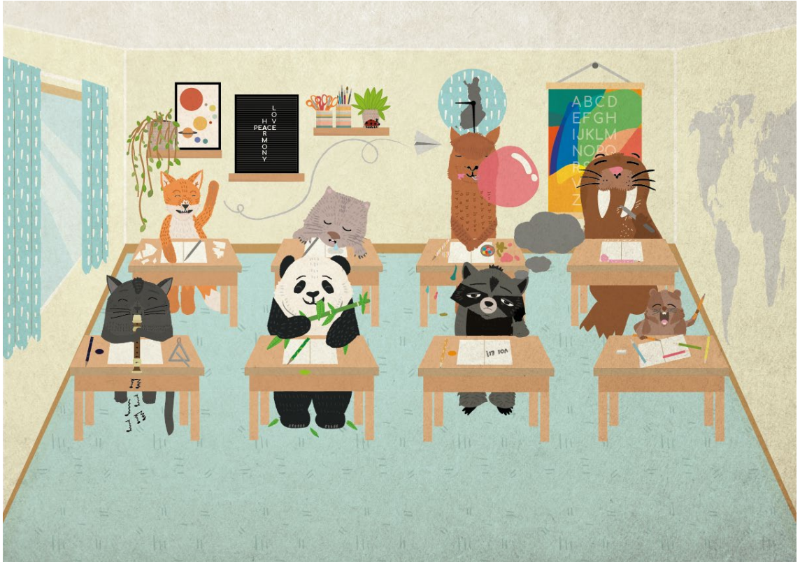
Kuva 3. Vertin koululuokassa on paljon hälinää ja keskittyminen on vaikeaa.

Mietin, miten saisin nämä tuntemukset parhaiten kuvailtua tarinan ja kuvituksen keinoin. Päätin, että saan parhaiten päähenkilön tuntemukset esiin, kun kuvailen kirjassa hänen arkipäivänsä kulkua. Tähän kuuluu esimerkiksi koulupäivän tuomat haasteet. Luokan hälinässä voi olla vaikeaa keskittyä opetukseen (Kuva 3).