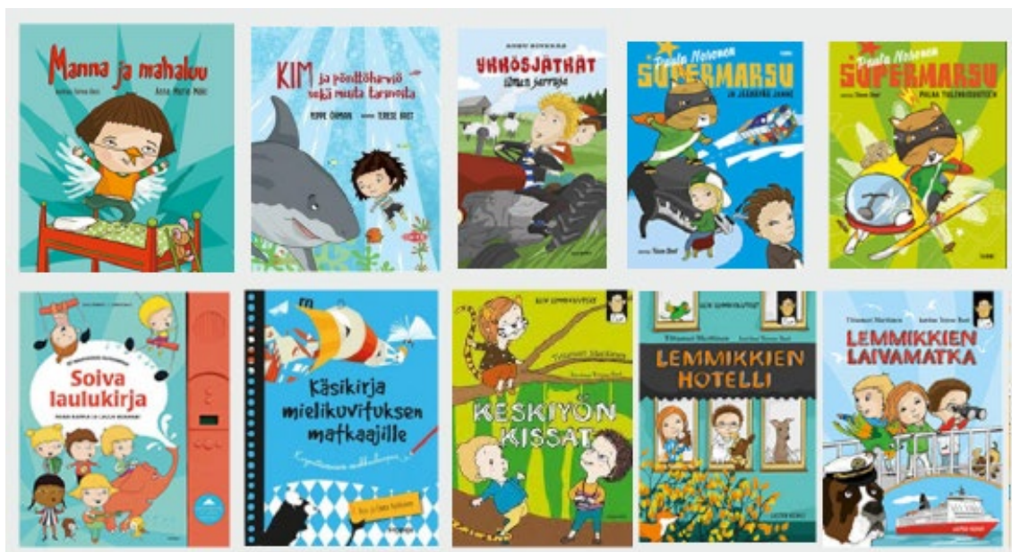
Kuva 20. Pieni ote Terese Bastin töistä. http://teresebast.businesscatalyst.com/#kuvitusillustration