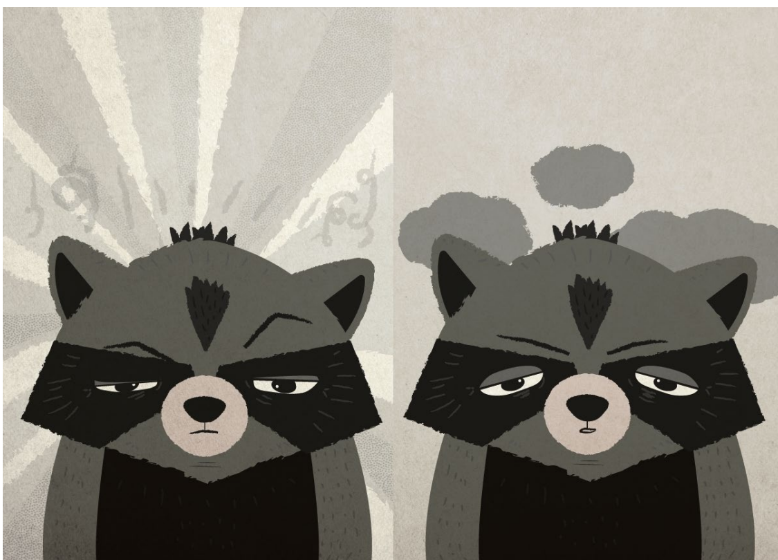
Kuva 17. Kuvitus omasta kirjasta. Rosoinen tekstuuri jatkuu läpi kirjan.

Digitaalisen kuvituksen vahvuudet ovat mielestäni ehdottomasti sen intensiivisyydessä ja monipuolisuudessa. Väreistä on mahdollista saada vahvoja ja kirkkaita ja tämä luo osaltaan dynaamista kuvakerrontaa. Toisaalta tunnelmaa ja kontrastia voidaan luoda erilaisilla tekstuureilla ja pinnoilla. Omassa työssäni halusin luoda tunnelmaa rosoisella tekstuurilla, joka toistuu jokaisessa kuvassa (Kuva 17). Rosoinen pinta tuo kuvakerrontaan hieman utuisen ja melankolisenkin tunnelman. Lisäksi se tuo toistuvuutta koko kirjan läpi. Digitaalisen piirtämisen etuja ovat myös helposti korjattavuus ja monistettavuus. Jos tehdään useampi samankaltainen kuva, kaikkea ei tarvitse aina piirtää alusta asti uudelleen, vaan jo tehtyä työtä on mahdollista monistaa ja muokata.