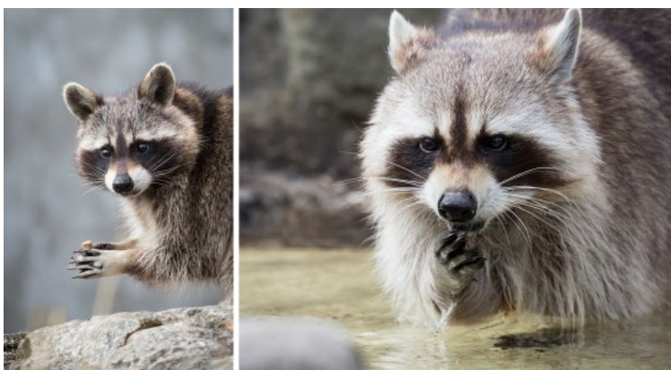
Kuva 4. Vertin lajitovereita, eli pesukarhuja. https://www.korkeasaari.fi/elain/pesukarhu/#!

Omassa kirjassani päähenkilö Vertti käyttäytyy monelta osin ihmisen tavoin, vaikka hän onkin pesukarhu. Hän käy koulua ja kävelee kahdella jalalla, kuten kuka tahansa lapsi. Tarina olisi voitu luoda yhtä hyvin ihmishahmon ympärille, mutta päätin tuoda hahmoon persoonallisuutta ja koomisuutta yhdistämällä sen hauskan näköiseen eläimeen. Eläimeksi valikoitui pesukarhu lähinnä siksi, koska niiden ulkonäkö ja käytös hauskuuttavat minua. Pesukarhut ovat persoonallisia eläimiä ja niillä on taitavat kädet, joita ne käyttävät tarttumiseen ja syömiseen ihmisen tavoin. Niillä on myös huvittava tapa pestä ruokansa ennen syömistä (Kuva 4).