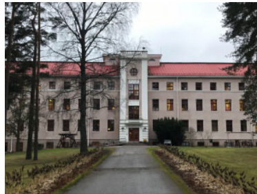
Halikon sairaala.

Pakon käytön vähentämiseen päästään myös lisäämällä vuorovaikutusta hoitajien ja potilaan kesken sekä lisäämällä ennaltaehkäiseviä toimenpiteitä ennen vaaratilanteiden eskaloitumista. Huomiota kiinnitetään erityisesti väkivaltariskin arviointiin käyttämällä validoituja arviointimittareita systemaattisesti.