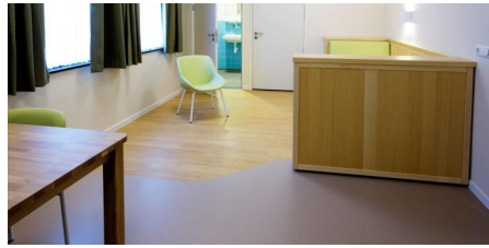
Turvaväli Tilburgin sairaalassa.

Tilburgin opintokäyntien lisäksi tehtiin opintokäynnit myös kahteen psychiatric high intensive care -yksikköön Englannissa. Tällä matkalla oli mukana henkilökuntaa myös muista Suomen sairaanhoitopiireistä.