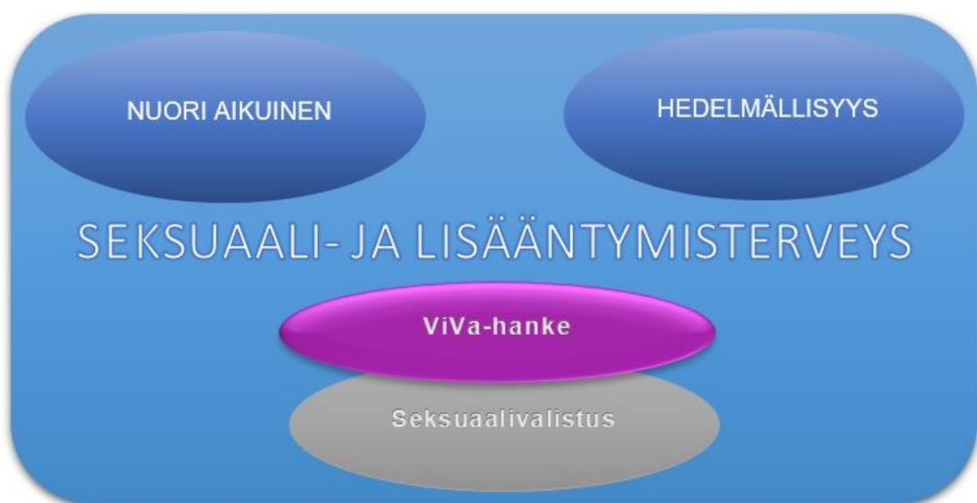
KUVIO 1. Teoreettiset lähtökohdat

Opinnäytetyön keskeisiä käsitteitä ovat seksuaalisuus ja lisääntymisterveys, hedelmällisyys, nuori aikuinen, seksuaalivalistus sekä ViVa-hanke. Seksuaali- ja lisääntymisterveys on pohjakäsite, joka vaikuttaa kaikkiin muihin käsitteisiin. ViVa-hanke on suunnattu nuorille ja nuorille aikuisille, sen yksi keskeinen ajatus on hedelmällisyyteen liittyvän tuntemuksen parantaminen. Opinnäytetyön tuotoksena toimii sarjakuva, joka on seksuaalivalistukseksi tarkoitettu ja se tulee ViVa-hankkeen käyttöön. Teoreettisia lähtökohtia havainnollistetaan kuviossa 1.