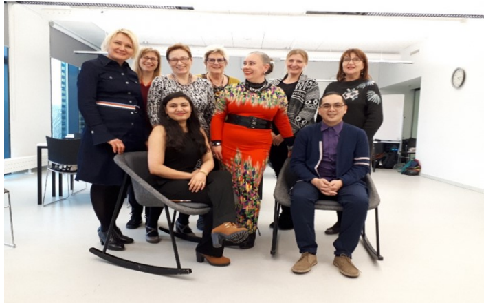
Kuva 2. Ensimmäiset valmistujaiset 28.2.2019 Helsingissä. Keinutuoleissa valmistuneet täydennyskoulutuksen käyneet sairaanhoitajat ja taustalla opettajatiimiä.

Ensimmäiset sairaanhoitajat valmistuivat helmikuussa 2019 (kuva 2). He ovat saaneet Valviran laillistuksen ja työllistyneet sairaanhoitajana Suomessa. Heistä oli artikkeli Tehy-lehdessä 9/2019. Tähän mennessä on jo valmistunut yhdeksän sairaanhoitajaa, yksi fysioterapeutti ja yksi bioanalytiikko.