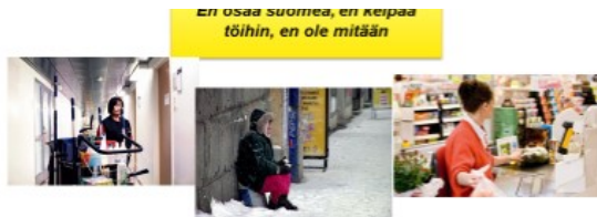
Kuva1. Osaamisen tunnistaminen ja tunnustaminen (Sairanen)

Lähtömaassaan maahanmuuttajilla oli oman ammatinsa pätevyys. He olivat taitavia ja osaavia sairaanhoitajia. Tullessaan Suomeen ei heidän sairaanhoitajan todistuksensa eikä ammattitaitonsa pitänyt täällä. Lisäksi he eivät osanneet suomen kieltä. Missä he olisivatkaan, jos eivät olisi hakeneet SOTE-sillan täydennysopintoihin? (Kuva 1.) SOTE-sillassa heidän ammatillinen osaamisensa tunnustetaan ja tunnustetaan. SOTE-silta mahdollistaa pääsemään oman ammatinsa töihin nopeammin.