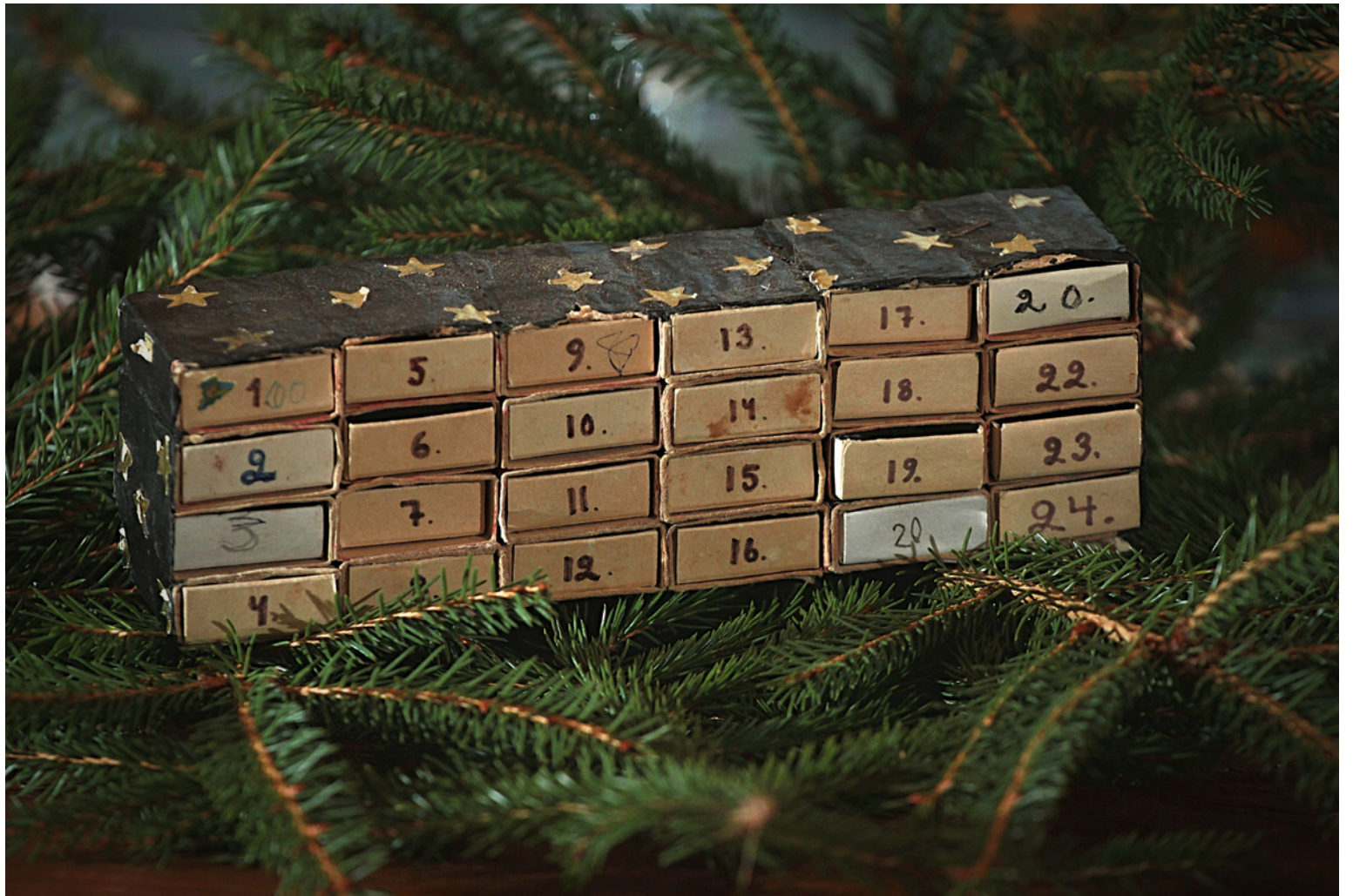
Julkalendern är cirka 40 år gammal. Den har limmats några gånger men är fortfarande i användning.

"Att köpa lokal mat och lokala mathantverksprodukter är en julgåva till lokala producenter och gynnar cirkulär lokal ekonomi."