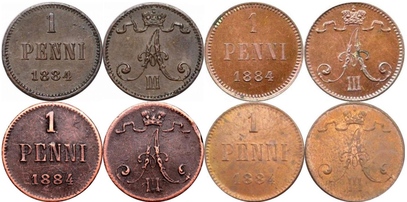
Kuva 2. Aidot ja väävät 1 pennin rahat 1884 sekä Kiinan tekeleet kuluneina ja hyväkuntoisina. Ylinnä aidot rahat, alinna tekeleet. Huomatkaa vasemmanpuolimmaisten kuluneiden rahojen pettävä samankaltaisuus. Kuvien yhdistely ja muokkaus Jorma Impola SeAMK.