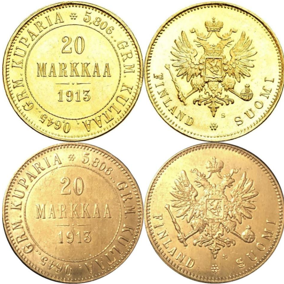
Kuva 4. Aito 20 markan kultarahaa vuodelta 1913 ylinnä ja kullattu 20 markan 1913 tekele alinna. Tekeleestä on kaupan COPY-stanssattuja ja stanssaamattomia versioita. Kuvien yhdistely ja muokkaus Jorma Impola SeAMK.