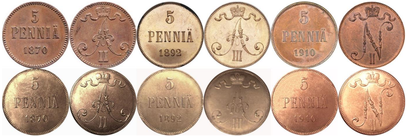
Kuva 5. Aitojen ja väärin 5 pennin rahojen 1870, 1892 ja 1910 vertailua. Aidot ylimmä, tekeleet alinna. Tekeleistä on kaupan COPY-stanssattuja ja stanssaamattomia versioita. Kuvien yhdistely ja muokkaus Jorma Imppola SeAMK.

Lähempi tarkastelu havainnollistaa 5-pennisten arvo puolten kirjainten ja numeroiden erot aitoihin verrattuna. On ilmeistä, että kaikki 5 pennin rahojen tekeleet on tehty samojen meistien kopioilla, joissa vain vuosiluku on muutettu. Kyseinen meisti pohjautuu rahatyypin nuorempaan malliin, jonka vuoksi ovat 5 pennin vuoden 1870 tekeleen arvo- ja tunnuspuolet aivan väärää tyyppiä, minkä huomaa erityisesti tekeleen kirjainten siroudesta alkuperäisiin verrattuna.