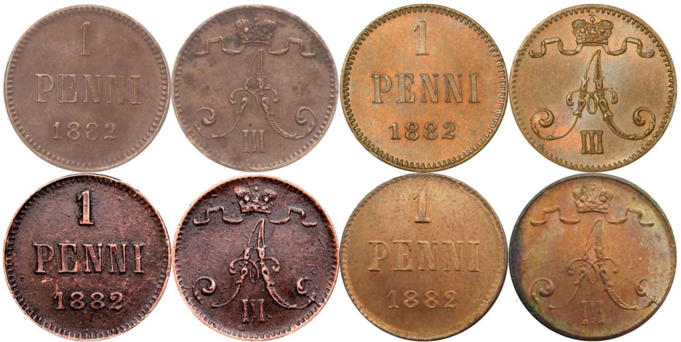
Kuva 1. Aidot ja väävät 1 pennin rahat 1882 sekä Kiinan tekeleet kuluneina ja hyväkuntoisina. Ylinnä aidot rahat, alinna tekeleet. Huomatkaa vasemmanpuolimmaisten kuluneiden rahojen pettävä samankaltaisuus.