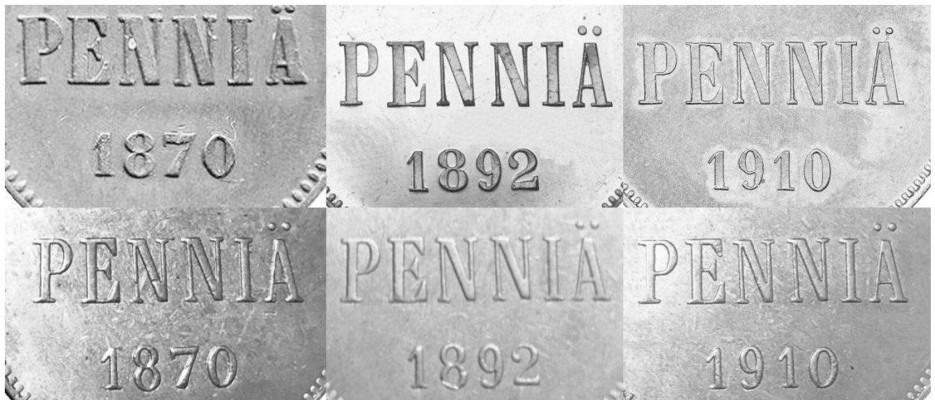
Kuva 6. Aitojen ja väärin 5 pennin rahojen 1870, 1892 ja 1910 arvo puolten tekstien ja vuosilukujen vertailua. Aidot ylimmä, tekeleet alinna. Huomatkaa tekeleiden kirjainten ja numeroiden heiveröisyys ja epätarkkuus aitoihin verrattuna.

Lähempi tarkastelu havainnollistaa 5-pennisten arvo puolten kirjainten ja numeroiden erot aitoihin verrattuna. On ilmeistä, että kaikki 5 pennin rahojen tekeleet on tehty samojen meistien kopioilla, joissa vain vuosiluku on muutettu. Kyseinen meisti pohjautuu rahatyypin nuorempaan malliin, jonka vuoksi ovat 5 pennin vuoden 1870 tekeleen arvo- ja tunnuspuolet aivan väärää tyyppiä, minkä huomaa erityisesti tekeleen kirjainten siroudesta alkuperäisiin verrattuna.