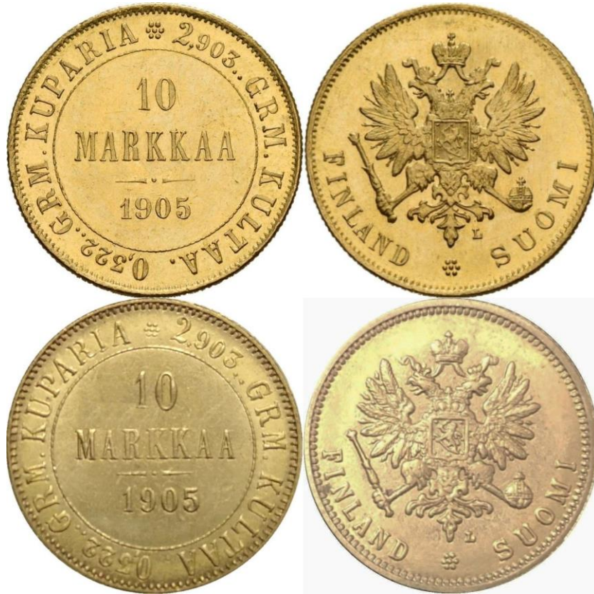
Kuva 7. Aito 10 markan kultarahaa vuodelta 1905 ylinnä ja kullattu 10 markan 1905 tekele alinna. Tekeleestä on kaupan COPY-stanssattuja ja stanssaamattomia versioita.