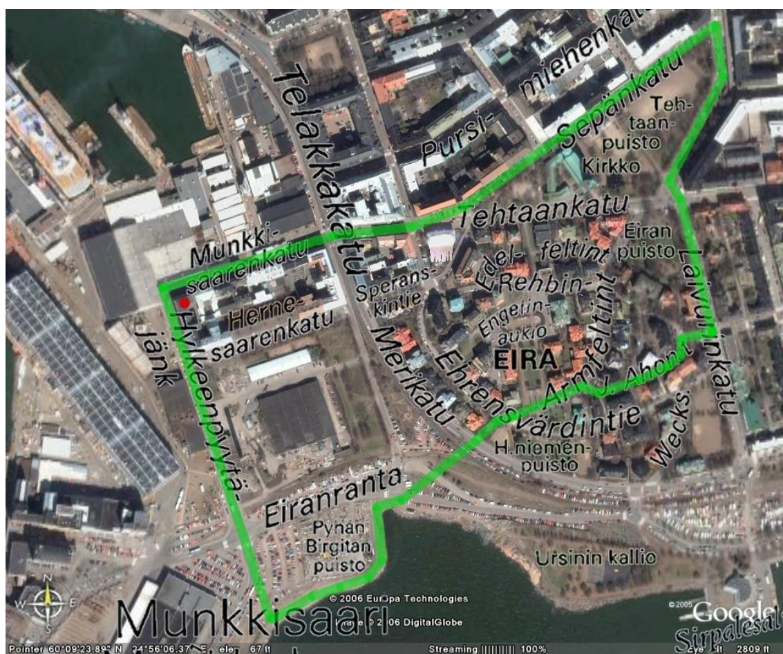
Liite 1 Munkkisaaren palvelukeskuksen ympäristökierros