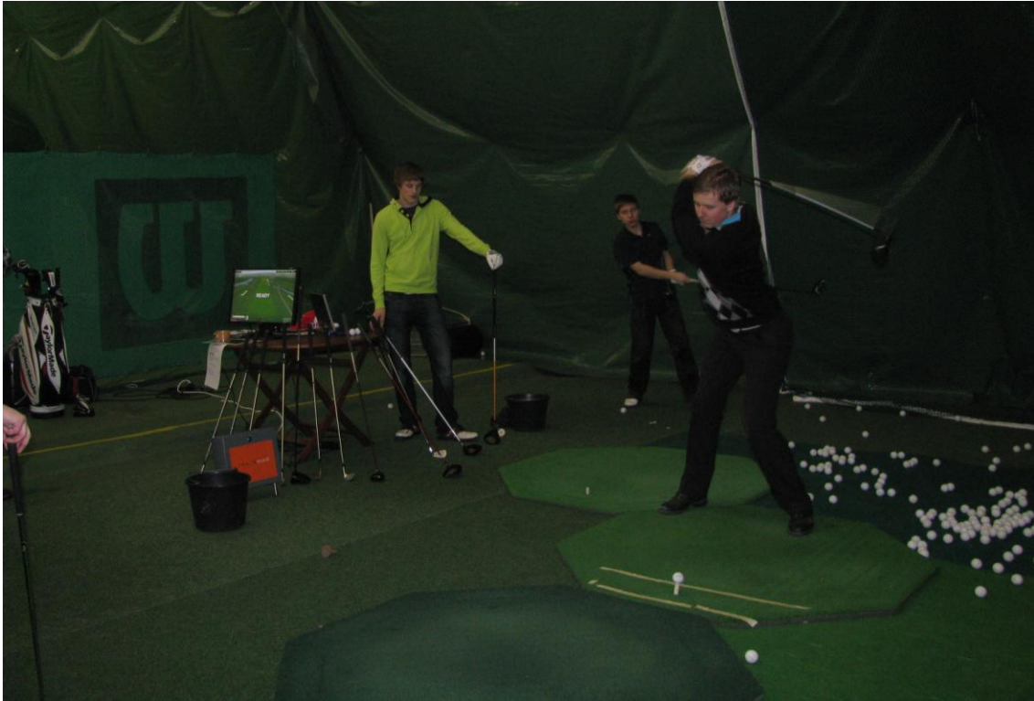
Pallo saa kyytiä TracMan –analyssaattorissa