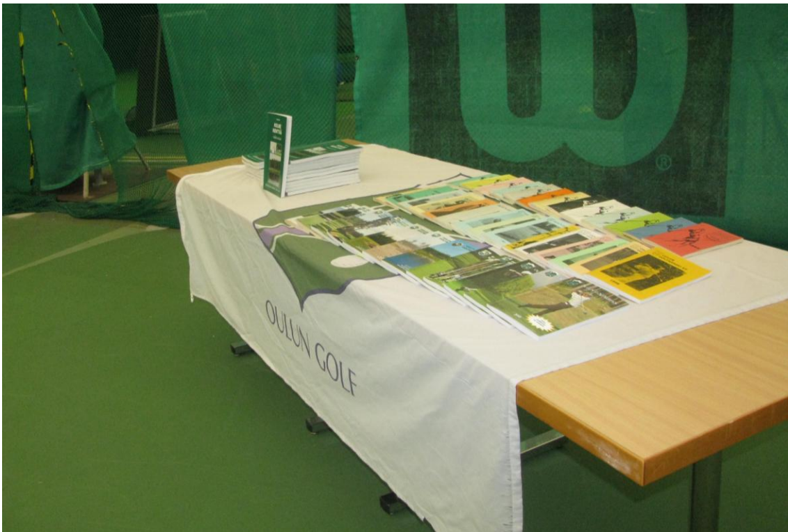
Historian havinaa Oulun Golfkerhon vuosikirjojen ja historiikin "Kolme kenttää –tuhat tarinaa" muodossa.