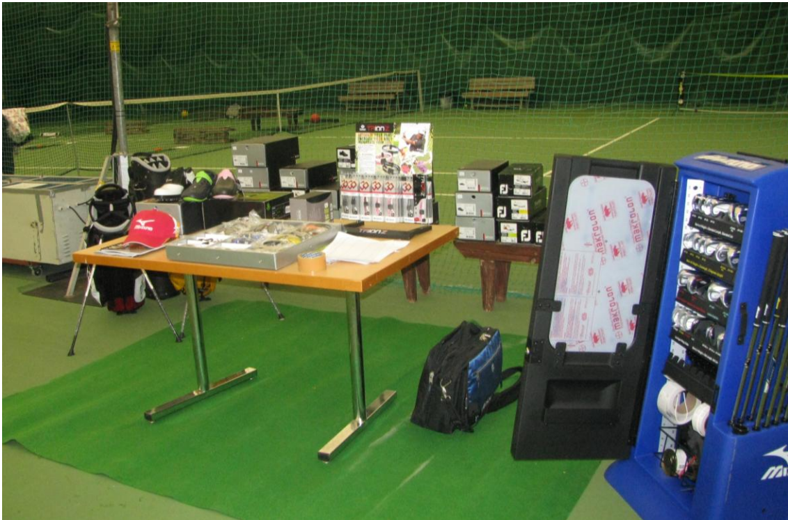
Golfshop esitteli uutuuksia.