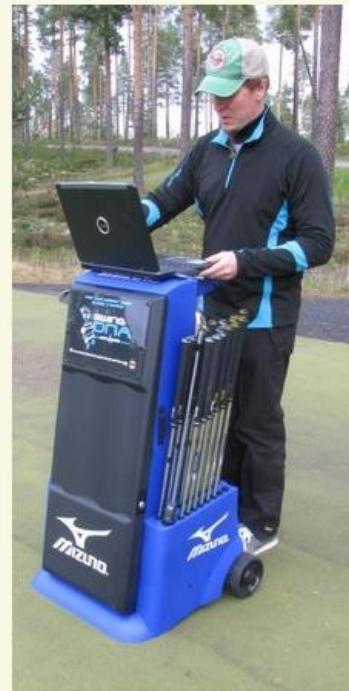
Mizunon fittausboksilla varmistat välineitteesi sopivuuden