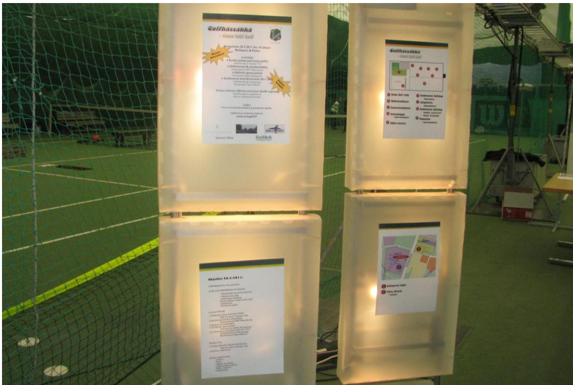
Infotaulut otti vastaan vierailijat.