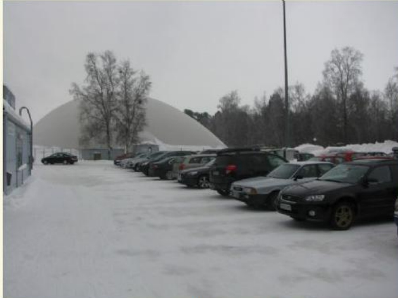
Parkkipaikka täyttyi heti aamulla!