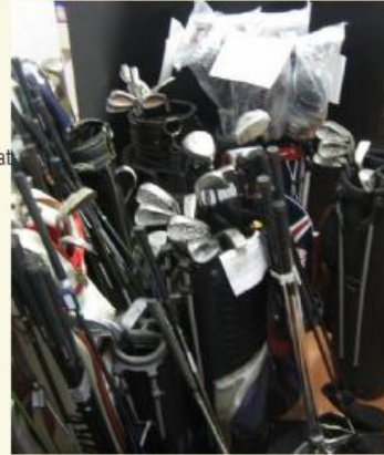
On TaylorMadea, Callawaytä, Cobraa Mizunoa. Laatumerkkejä hintaluokassa 3€-70€

Luennot alkavat Pohton tiloissa klo 11:00 ja näille luennoille on täytynyt ilmoittautua ennakkoon.