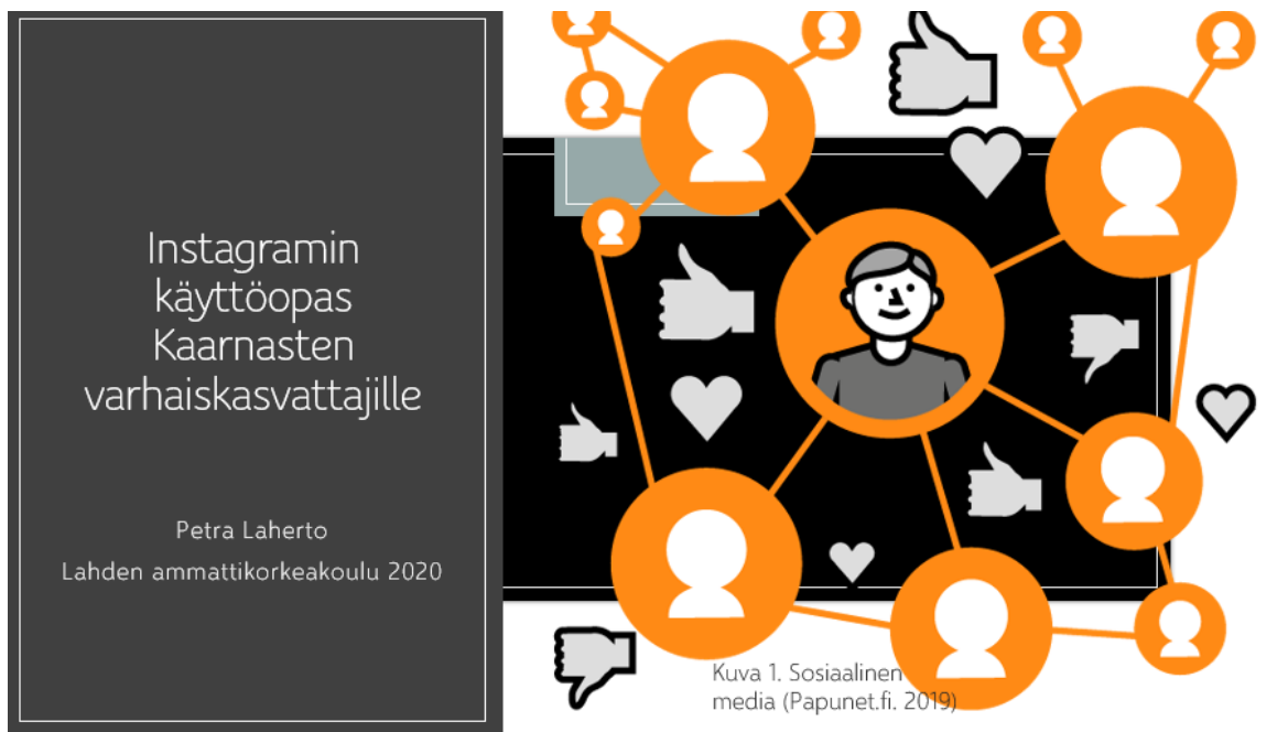
Kuva 3. Kuvakaappaus Instagramin päivittämiseen ohjaavasta oppaasta

Opas tullaan esittelemään julkaisuseminaarissa opinnäytetyön toimeksiantajan tiloissa Lehvätien päiväkodilla Kaarnasten kasvattajille ja kyseisen varhaiskasvatusyksikön johtajalle tammikuun 2020 aikana. Opas on sähköinen, mutta se tulostetaan Kaarnasten ryhmään myös paperiseksi versioksi.