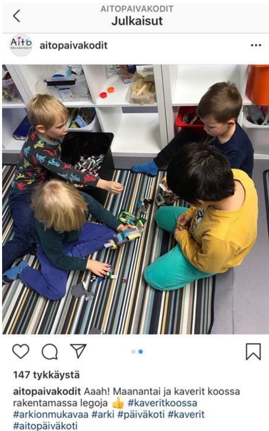
Kuva 1. Kuvakaappaus Aito-päiväkodin Instagram-julkaisusta (Instagram 2019)