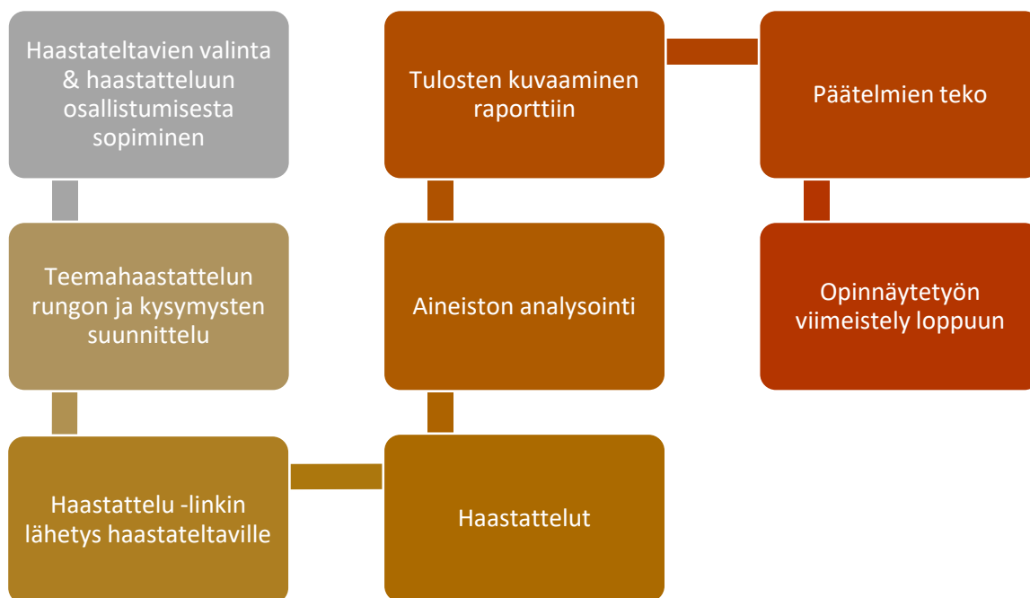
Kuvio 2. Opinnäytetyöprosessin eteneminen