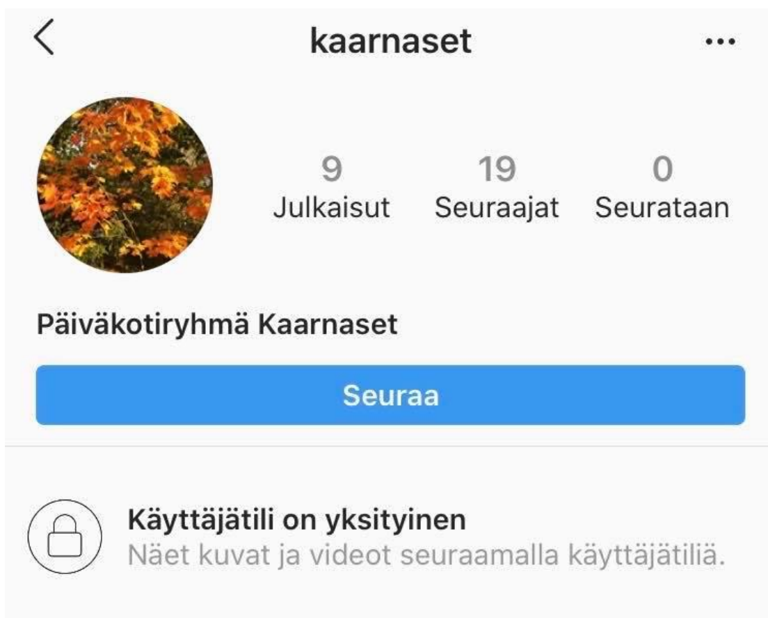
Kuva 2. Kuvakaappaus Kaarnasten Instagram -tilistä (Instagram 2019)

Kaarnasten Instagram-tili määriteltiin alusta alkaen yksityiseksi tietoturvasyistä, ja siksi sen sisällöstä ei ole kuvia raportissa. Kuva 2. konkretisoi kuitenkin tilin ulkonäköä ulkopuolisen Instagram -käyttäjän näkökulmasta katsottuna.