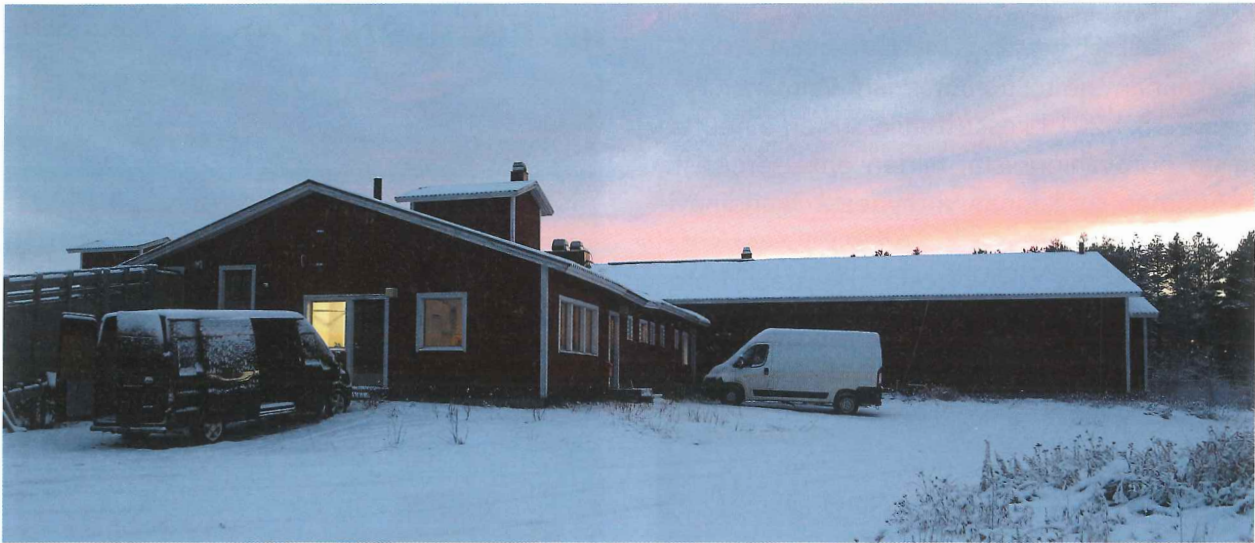
Kittilän teurastamon yhteydessä toimii myös leikkaamo.

PORUKKAOPPIA TEURASTAMOILLE -KOULUTUSHANKE