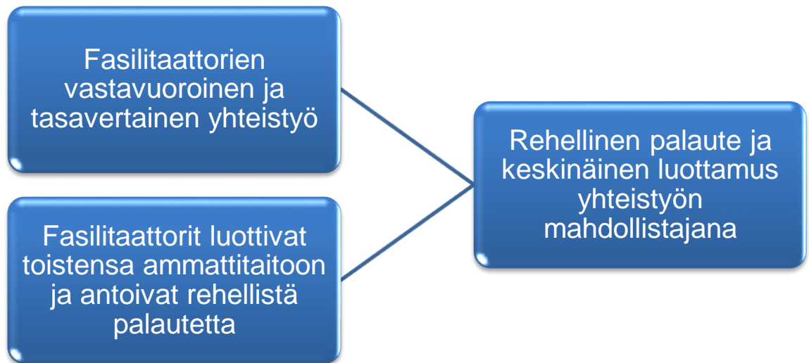
Kuvio 1. Rehellinen palaute ja keskinäinen luottamus yhteistyön mahdollistajana.