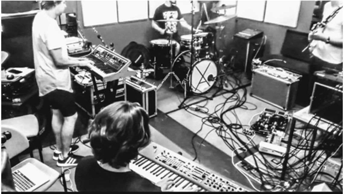
Kuvio 4. Bändiharjoitukset 17.6.2019