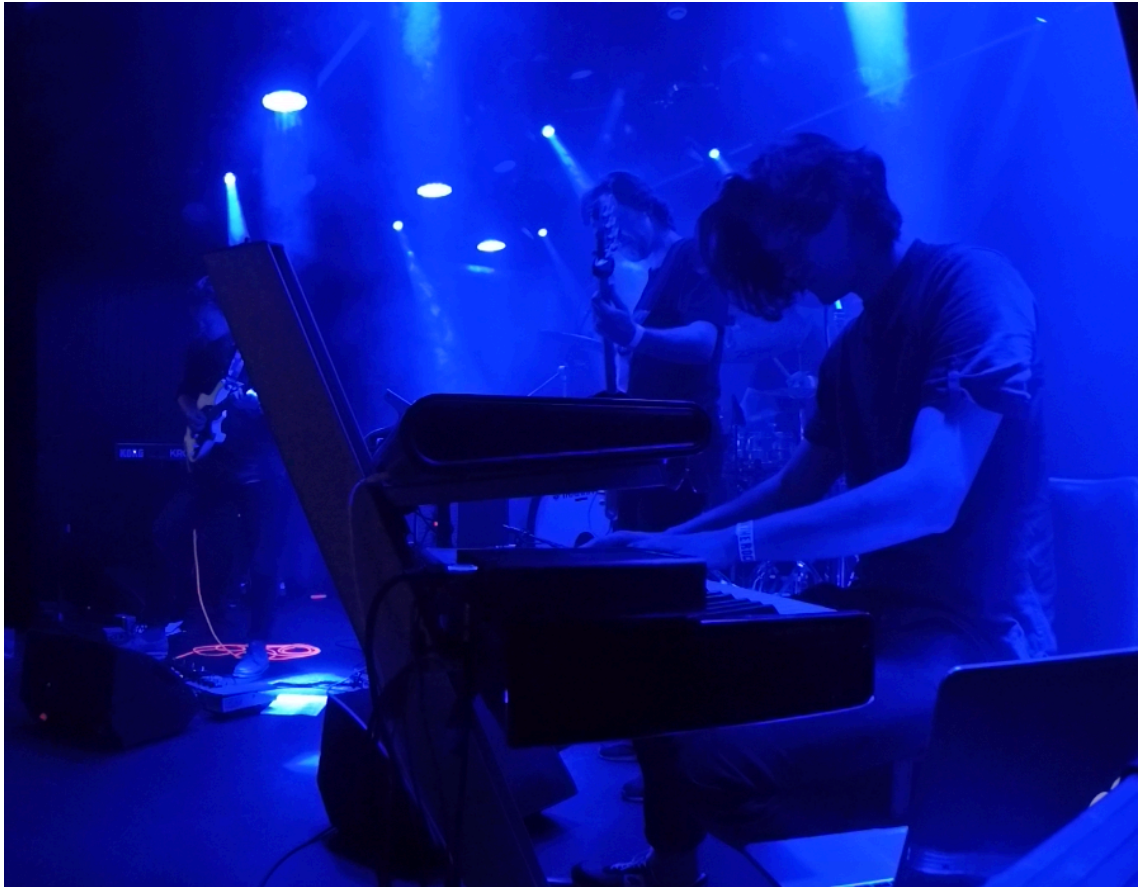
Kuvio 5. Ensimmäinen esiintyminen, On The Rocksin lava 25.6.2019.