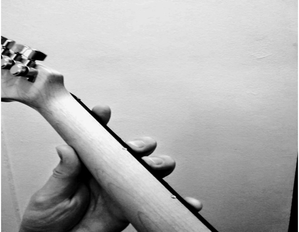
Kuvio 2. Kuvassa otelaudan takapuolelta esimerkki peukalon sijainnista sormille miellyttävän venyvyyden saavuttamiseksi. Sopiva paikka peukalolle löytyy kaulan keskikohdalta tai sen alapuolelta. Kuvassa etusormi ensimmäisellä nauhalla ja pikkurilli viidennellä.