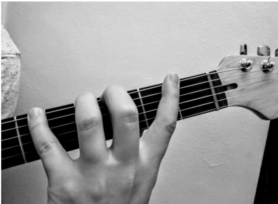
Kuvio 1. Kuvassa vasen käsi havainnollistettuna otelaudan puolelta, sormituksen ja käden esimerkkiasento

Käytännössä tämän aloittaminen tarkoitti harjoittelua ja työskentelyä skaalojen sekä asteikoiden kanssa. Murensin näitä asteikkoja pieniksi paloiksi pitkin kitaran otelautaa ja kävin läpi näiden lukuisia eri variaatioita. Tätä kautta aloin löytämään aivan uusia sävyjä ja elementtejä helposti yksinkertaisistakin asioista. Harjoittelin myös asteikoita 'neljä ääntä per kieli' -metodilla tyypillisemmän kolmen tai kahden äänen sijasta. Tämä vaati vasemmalta kädeltä ja pikkurilliltä hieman venyvyyttä. Sopiva sormien etäisyys, venyvyys ja rentous ranteeseen löytyi sitä mukaa, kun vasemman käden peukalo ei kurottanut yli kaulan puolivälin korkeudelle.