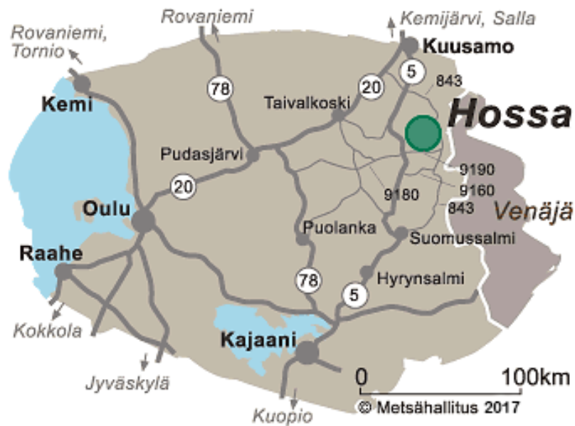
Kuva 2. Hossan kansallispuiston sijainti (Metsähallitus 2017).

Vuonna 2018 Hossan kansallispuiston kävijämääräksi laskettiin 101 500. (Metsähallitus 2019.) Hossan kansallispuisto on tunnettu alueelta löydetystä Värikallion kalliomaalauksista. Ne ovat ainakin toistaiseksi ainoita Kainuusta löydettyjä esihistoriallisia kalliomaalauksia. (Heikkinen 2002, 118.) Hossan kansallispuiston toinen tunnetuista nähtävyyksistä on mahtava kanjonijärvi, Julma Ölkky, joka sijaitsee Kuusamon puolella Hossan Värikalliosta muutama kilometri pohjoiseen. Julman Ölkyn kanjonijärvi on yksi Suomen suurimmista kanjonijärvistä. Julma Ölkky on pituudeltaan noin kolme kilometriä ja noin 15 hehtaaria laaja kapea kanjonijärvi, joka on kapeimmalta kohdalta vain noin kymmenen metriä leveä. (Hossa 2019.) Hossan polkuja voi retkeillä niin pyöräillen kuin patikoidenkin sekä kansallispuiston vedet houkuttelevat melomaan ja kalastamaan. Hossan kansallispuisto sopii hyvin koko perheelle ja puistosta löytyy myös reittejä liikuntarajoitteisille. Osa poluista on kuljettavissa pyörätuolilla sekä sieltä löytyy liikuntaesteisille soveltuvia kalastuslaitureita, laavuja ja vuokramökkejä. Kansallispuistossa on polkuja yhteensä noin 90 kilometriä. (Luontoon.fi 2019.) Hossan kansallispuisto on parhaiten saavutettavissa omalla autolla, mutta julkisilla kulkuvälineillä pääsee melko lähelle kansallispuiston rajaa. (Hossa 2019.)