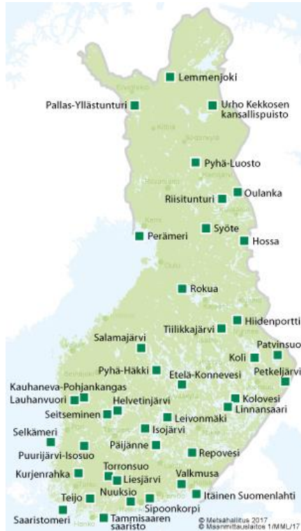
Kuva 1. Kansallispuidot kartalla (Metsähallitus 2017).

suosittiin pääasiassa vain luonnonpuistojen perustamista, mutta sitten ymmärrettiin kansallispuiden palvelevan paremmin retkeilyn tarpeita, kun taas luonnonpuistot olivat perustettu lähestulkoon pelkästään tieteellisiin tarkoituksiin. (Luontoon.fi 2019.)