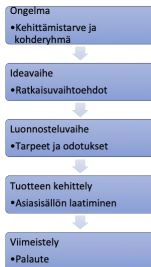
Kuvio 1. Tuotteistamisprosessi ja keskeisimmät asiat prosessin vaiheista. (Jämsää ja Mannista 2000: 85 mukailen.)

Oppaan tuotekehittelyprosessissa sovelsimme tuotteistamisprosessin vaiheita (ks. kuvio 1). Tuotteistamisella tarkoitetaan uuden palvelun tai aineellisen tavaran kehittämistä ja sen markkinointia. Tuotteen tarkoitus on informatiivisen tiedon levittäminen asiakkaalle, työntekijöille tai yhteistyötahoille. Tuotteen keskeisin piirre on terveyden ja hyvinvoinnin sekä elämänhallinnan edistäminen. (Jämsä & Manninen 2000: 13,14.) Oppaan tarkoituksena on lisätä työntekijöiden tietoisuutta pääkaupunkiseudun ikääntyville tarkoitetuista palveluista. (ks. liite 3.) Tietoa voi hyödyntää vapauttamissuunnitelmaa laatiessa. Oppaasta löytyy myös palveluita ja toimijoita, joita voi hyödyntää vängin lomapäivien suunnittelussa.