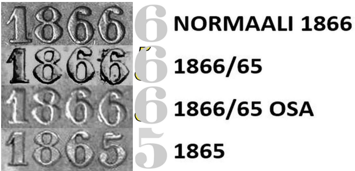
Kuva 3. 25 penniä 1866/65 vuosiluvun vertailua. Havainnepiirroksessa näkyvät 5:n osat keltaisella värillä. Kuvien yhdistely ja muokkaus Jorma Impola.

Seuraavassa kuvassa 3 on vertailtu variantin 1866/65 vuosilukua normaaliin vuosilukuun 1866, osittaisen variantin 1866/65 vuosilukuun sekä vuosilukuun 1865. Tämä uusi variantti, jossa vanha numero 5 näkyy monin osin numeron 6 alla on hyvin harvinainen, en löytänyt mistään kuvaa vastaavasta. Variantti 1866/65, jossa vanha numero 5 vain kurkkaa numeron 6 alta noin kello 8:ssa on sen sijaan aika yleinen.