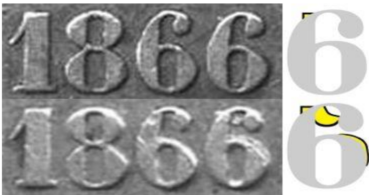
Kuva 7. 2 markkaa 1866/65 vuosiluvun viimeisen numeron 6 vertailua. Ylempänä tavallinen variantti, jossa viimeisen numero 6: ”niskassa” kello 11:ssä näkyy numeron 5 vasen yläkulma. Alempana variantti, jonka viimeisen 6:n alta näkyy numeron 5 koko lipa ja alaosan kaari. Havainnepiirroksessa näkyvät 5:n osat keltaisella värillä. Kuvien yhdistely ja muokkaus Jorma Imppola.

Tavallisin 1866/65 variantti esiintyy 2 markan rahoissa. Oikeastaan on liki mahdotonta löytää 2 markan rahaa vuodelta 1866, jossa viimeinen 6 olisi täysin ”puhdas”.