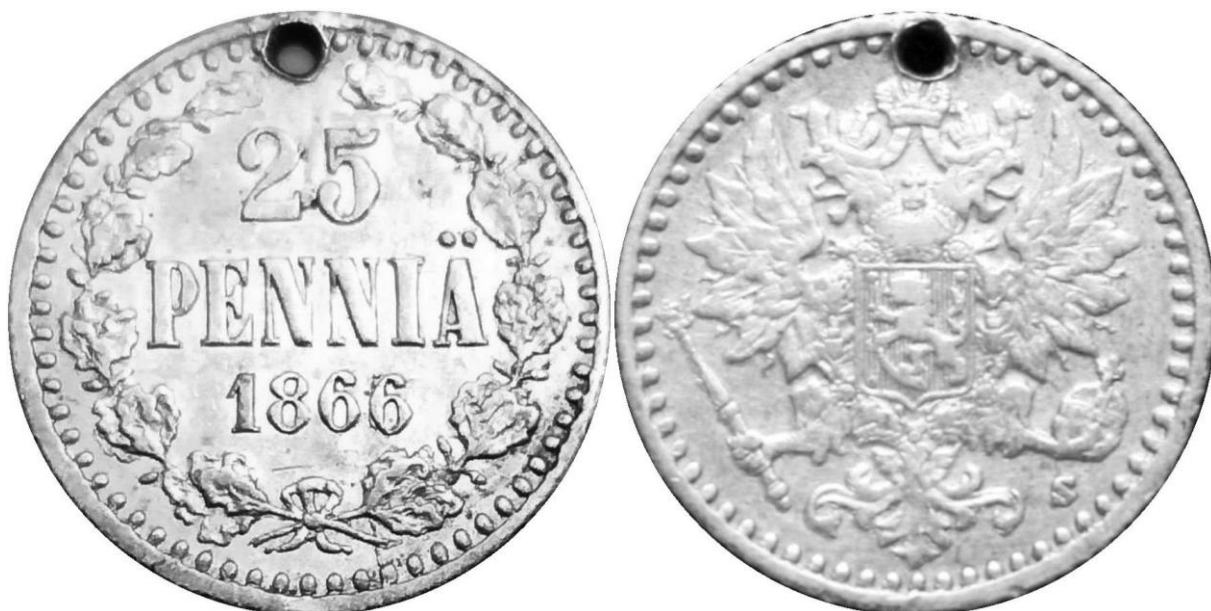
Kuva 1. 25 penniä 1866/65 arvopuoli ja tunnuspuoli.

Tuohon aikaan oli miltei kaikissa rahapajoissa varsin tyyppillistä käyttää jo tehdyt mestit nuukasti hyödyksi. Uusien meistien tekeminen oli hyvin työlästä, koska ne tehtiin käsityönä ja ne olivat yksittäiskappaleita. Varsinkin suurien lyöntimäärien ollessa kyseessä jouduttiin loppuun kuluneita tai rikkoutuneita meistejä uusimaan aika ajoin. Ja koska mestit eivät olleet valmistuksen käsityövaltaisuuden takia täysin identtisiä syntyi mitä mielenkiintoisimpia variantteja. Myös vuoden vaihduttua oli varsin tyyppillistä käyttää vielä ehjiä edellisen vuoden meistejä hyödyksi kaivertamalla meistin vuosiluku vanhan päälle muuttuneen numeron osalta vastaamaan kuluva vuotta.