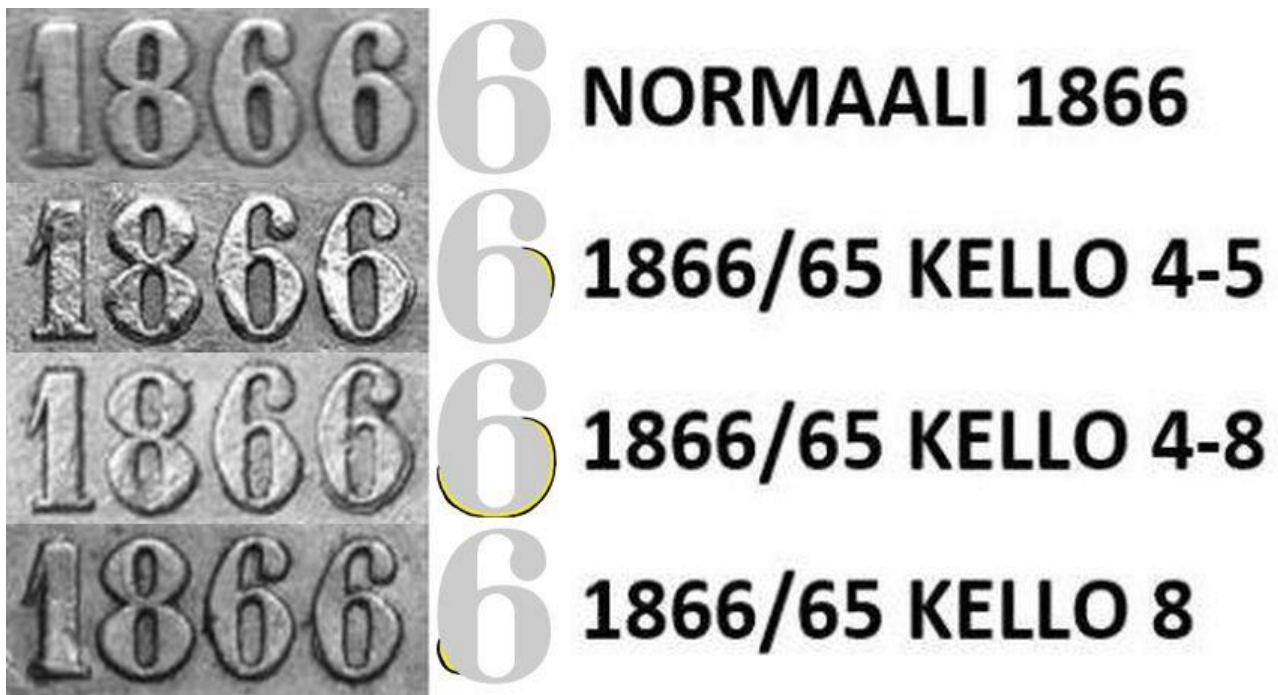
Kuva 6. 1 markka 1866/65 vuosiluvun viimeisen numeron 6 pullistumien vertailua. Havainnepiirroksessa näkyvät 5:n osat keltaisella värillä. Kuvien yhdistely ja muokkaus Jorma Imppola.

Tavallisin 1866/65 variantti esiintyy 2 markan rahoissa. Oikeastaan on liki mahdotonta löytää 2 markan rahaa vuodelta 1866, jossa viimeinen 6 olisi täysin ”puhdas”.