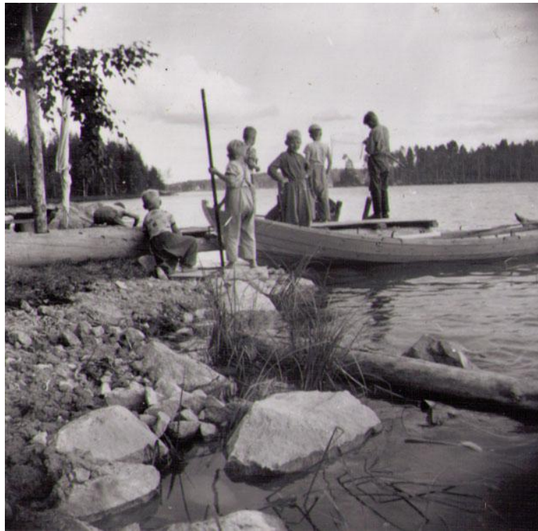
KUVA 8. Kesän viettoa Keiteleen rannalla. (Äänekosken Perhetukikeskuksen valokuva -albumi n. d).

Luja yhteisöllisyys lasten kesken korostui haastatteluissamme selkeästi 1960 - 70 - luvulla ja vielä 80 - luvullakin. Yhdessä leikittiin ja touhuttiin, oltiin yhtä isoa perhettä. Harrastukset koettiin tärkeiksi ja myös harrastettiin. Harrastusten myötä monen nuoren itsetunto sai vahvistusta.