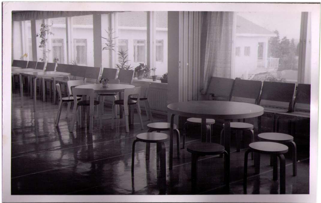
KUVA 4. Valokuva uudesta ruokasalista vuonna 1953.

Lodelle muutto tapahtui vauhdikkaasti. Tiloja laitettiin kuntoon ja paikkoja sisustettiin. Mamma valitsi, laatutietoisena ihmisenä, kalliit ja laadukkaat kalusteet ja työntekijät kutoivat ja ompelivat tekstiilejä. (h 1.)