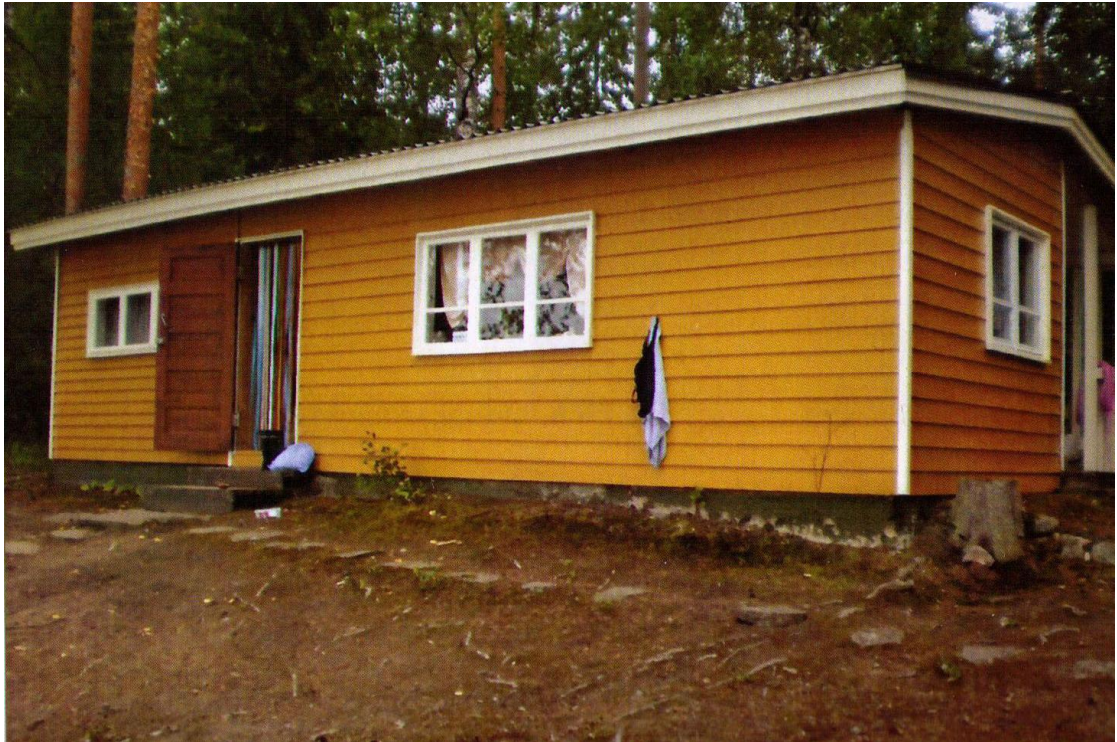
KUVA 6. Mamman mökki (Makkonen 2008, 117).

Mamma oli rakennuttanut Loden lasten käyttöön mökin, jota vielä tänäkin päivänä muistellaan Mamman mökinä. Se oli tehty hyvin pitkälle talkootyönä, mutta Mamma oli kustantanut itse kaikki materiaalit. Monta ihanaa muistoa nousee entisten lastenkodin asiakkaiden mieleen, ajasta, jonka he viettivät Mamman mökillä. (t 50 – 60.)