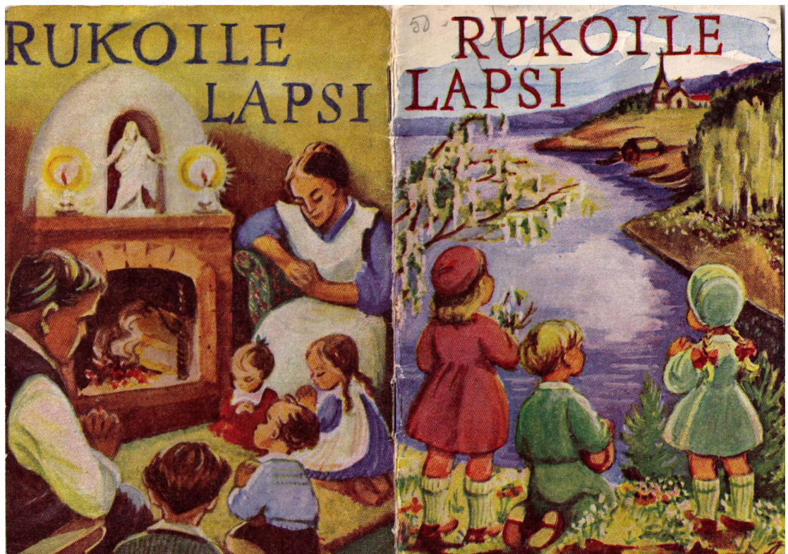
KUVA 7. Lasten rukouskirja. (Suomen Pyhäkouluyhdistys n.d.)

Ruokarukouksia pidettiin yleisesti vielä 1970 - luvun alussa useissa lastenkodeissa. Joskus ruokarukouksen luki hoitaja, joskus kaikki lukivat sen yhteen ääneen ja joissain lastenkodeissa rukous oli vain hiljainen hetki ennen ruokailua. Lapsia pyrittiin ohjaamaan hyviin pöytätapoihin ja kohteliaaseen käytökseen. Aterioilla pyrittiin kuitenkin vapautuneeseen tunnelmaan. (Suometsä 1972, 81.)