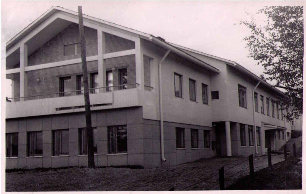
KUVA 3. Uusi lastenkoti 1953.

Äänekosken uusi lastenkodin rakennus oli suuri kokonaisuus, jossa alakerrassa oli keittiö ja päiväkotit ja yläkerrassa lastenkoti. Lastenkodin vieressä oli kerrostalo, johon Äänekosken kauppalan äitiys - ja lastenneuvolat siirtyivät 1.9.1953. (Äänekosken Perhetukikeskuksen lehtileikekansio n. d.) Terveystalon yhteydessä oli myös asuntoja, jossa johtajan tai kauempaa töihin tulevien työntekijöiden oli mahdollista asua (h 1).