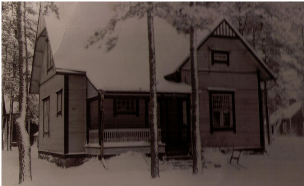
KUVA 1. Piilolanniemen lastenkoti 1940 - luvun lopussa.

Pian kuitenkin huomattiin, että tilat kävivät ahtaiksi ja kaikki vanhemmat eivät voineet, erinäisistä syistä, hoitaa itse lapsiaan. Tämän vuoksi lastenkodin tarve kasvoi suureksi. Äänekosken Piilolanniemeen rakennettiin lastenkoti 1940 - luvun loppupuolella. (Makkonen 2008, 5.)