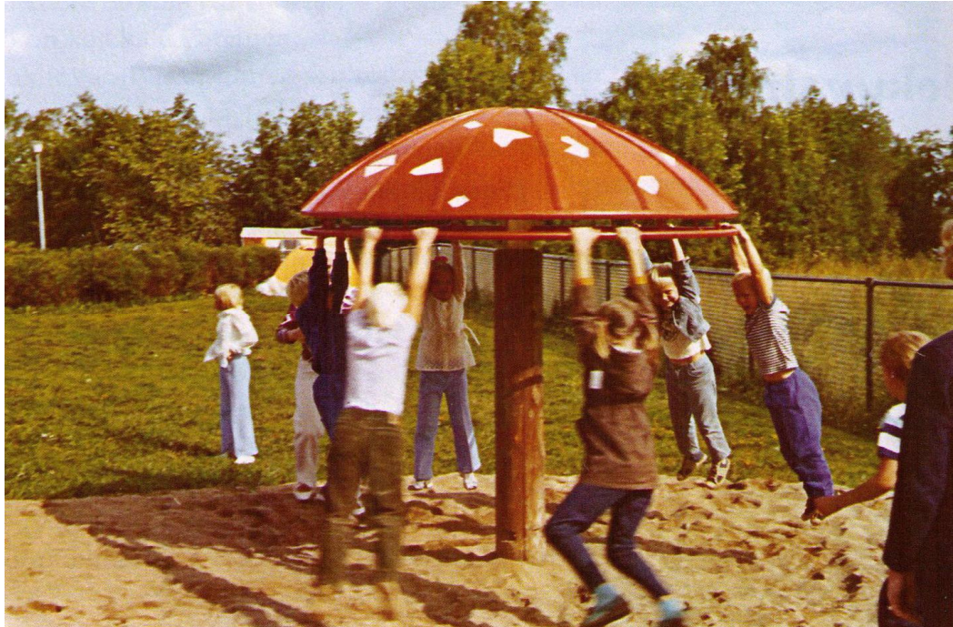
KUVA 9. Riemua Ahvenanmaan reissulla (Makkonen 2008, 112).

Retkiä tehtiin hirveesti, just nää sieni- ja marjaretket, urkkakentällä on semmonen tonttukivi, siellä on korkea kivi me uskottiin oikeesti että sen alla asuu tonttu... Ahvenanmaalla käytiin kerran ja onkohan se sit ollu samassa yhteydessä se meidän Helsingin matka, todennäköisesti. Eikä varmaan kauheesti, ainakaan mua, kiinnostanukaan silleen, meille riitti varmaan aika hyvin tuo maailma mikä meillä oli. (a 60.)