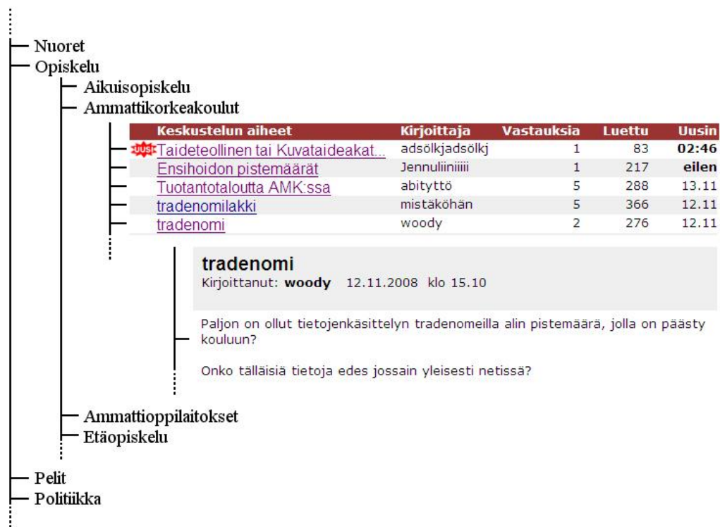
KUVIO 1. Suomi24-keskustelupalstan rakennetta.