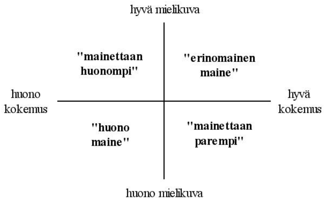
KUVIO 3. Maineen nelikenttä (ks. Heinonen 2006, 29.)

Asiakkaalle yrityksestä muodostuvaa kuvaa voidaan havainnollistaa maineen nelikentän avulla (Heinonen 2006, 28 - 30). Maineen nelikenttä on kuvattu kuviossa 3. Kuva esittää kokemusten ja mielikuvien välistä suhdetta eli sitä, miten kokemukset vaikuttavat yrityksestä saataviin mielikuviin (Heinonen 2006, 28).