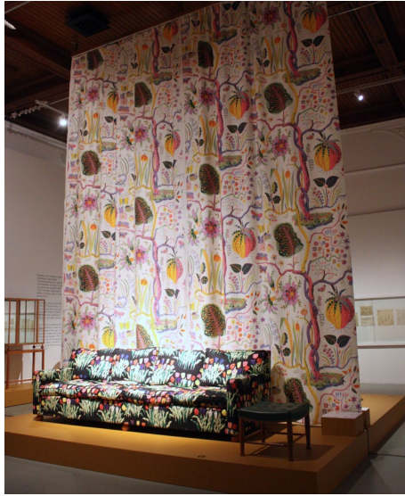
Suurina pintoina nähdyt kankaat keräsivät kehuja ja mielenkiintoa tilan tuntuun liittyen.

vasta viiveellä, kuinka vahvasti McQueen-näyttelykokemus oli muuttanut suhdettani museoon. Halusin uppoutua aiheeseen entistä syvemmin, minkä innoittamana löysin ratkaisun jatkokoulutus suunnitelmiini. Pääsin opiskelemaan kulttuurituotannon ylempää ammattikorkeakoulututkintoa ja kirjoittamaan opinnäytetyötä museonäyttelyiden moniaistisuudesta.