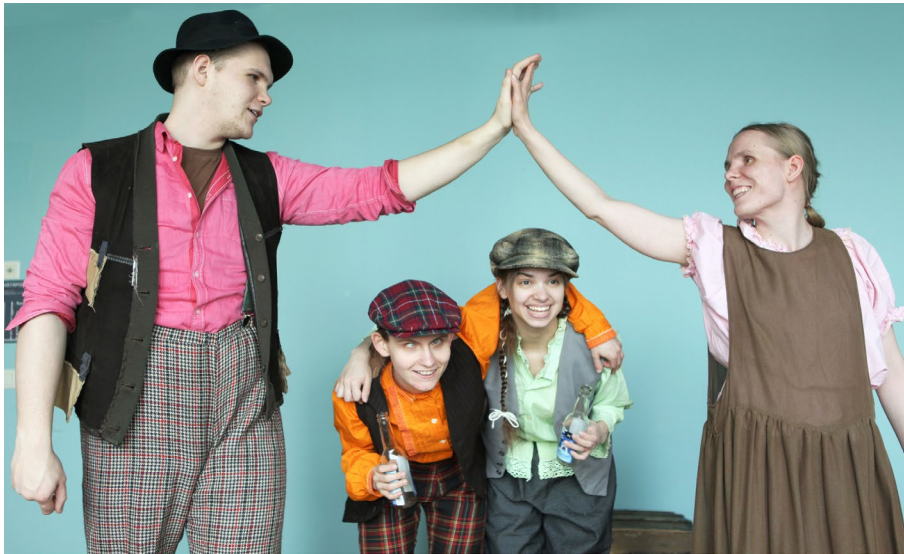
Näkövammaisteatterin Hatunvaihtoa lastenkamarissa 2018.

on asia, jota olen pyörätellyt päivittäin työpöydälläni. Kulttuuridemokratia, todellinen osallisuus, menee kuitenkin kulttuurin demokratisaation, saavutettavuuden varmistamisen edelle.