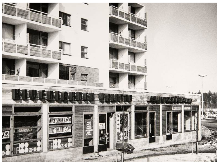
Kivenlahden Valinta ja Asuntosäätiön infopiste 1970-luvulla.

pitää yllä keskustelua tai käydä muistuttamassa kysymyspape-reihin kirjoittamisesta. Vastauksia ja keskusteluja riitti jokai- sessa kolmessa pajassa.