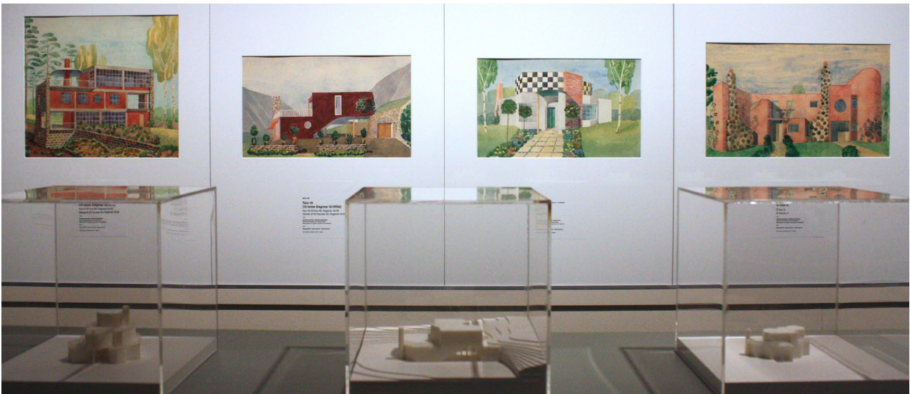
Myös fantasiatalot houkuttelivat monesta näkökulmasta. Kiinnostavinta olisi ollut astua sisään VR-lasien kautta.

lähinnä mielikuvien kautta. Frankin tuotanto sisälsi runsaasti luontoon liittyviä elementtejä ja näiden herättämät mielikuvat veivät osallistujaa kokonaan uusiin ajatusmaailmoihin.