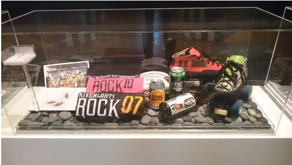
Kivenlahtiosion vitriini näyttelyssä Katse horisontissa.

ja ryhtyä heti pohtimaan, kuinka museo voisi viedä paikallisten asukkaiden toiveita eteenpäin.