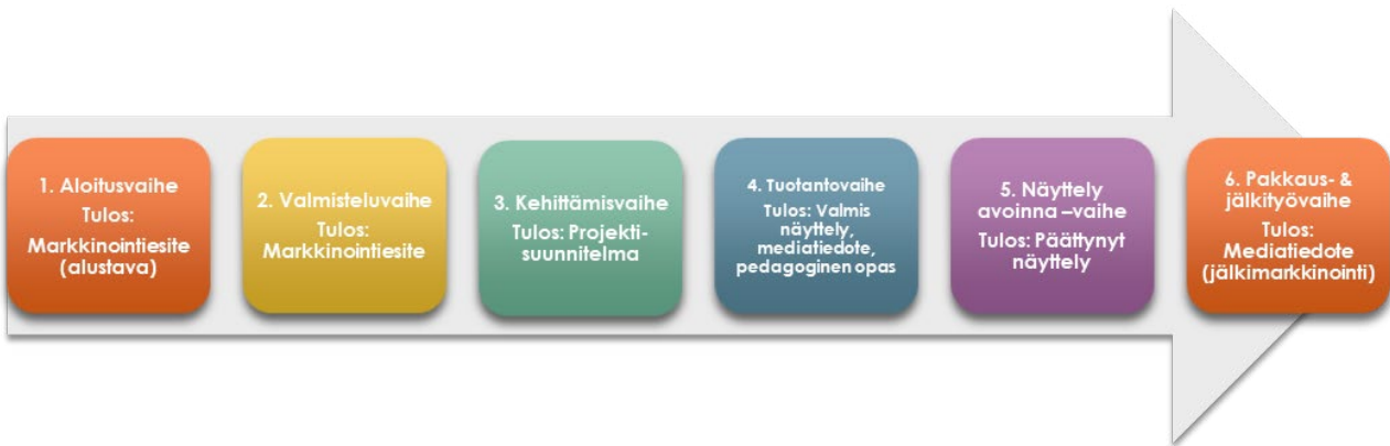
Kuvio 1 Näyttelytoiminta = Lastenkulttuurinäyttely + oheisohjelma

vuoden 2018 raportin mukaan yli miljoona asiakasta. Näyttelytoiminnan parissa näyttelyissä ja opastuksissa kokonaiskävijämäärä oli lähemmäs 200 000. Samansuuntaiset kävijäluvut olivat vuonna 2018 suurilla museoilla, mikä selviää Museovieraston kokoamasta museotilastosta: Helsingin taidemuseossa (HAM) kävijöitä oli noin 170 000, Luonnontieteellisessä museossa 164 000 ja Kansallismuseossa lähemmäs 225 000.