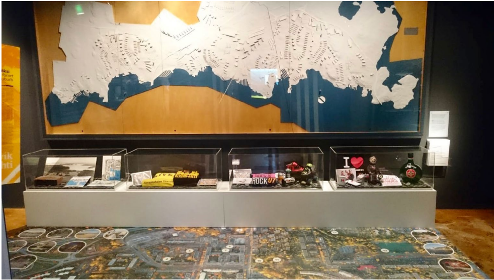
Alvar Aallon lounaisrannikkosuunnitelma seinällä ja ilmakuva Kivenlahdesta lattiassa näyttelyssä Katse Horisontissa.

dessä Kivenlahtisuklaata, paikallisen graffititaiteilijan kanssa suunnitellaan tapahtumaa ja valokuvaajan kanssa hänen kuviinsa perustuvaa näyttelyä.