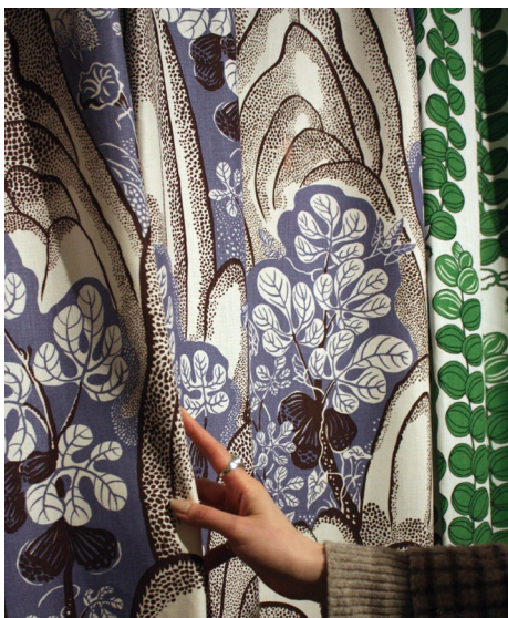
Svenskt Tennin kankaita pääsi koskettelemaan ja liikuttelemaan - tämä keräsi paljon kiitosta.

saapui Helsinkiin Itävallan taideteollisuusmuseo Austrian Museum of Applied Arts / Contemporary Art:ista (MAK). Näyttely kertoi kokonaisvaltaisesti Frankin urasta ja ajattelusta, käyden läpi sosiaalisen asuntotuotannon, työskentelyn Haus & Gartenilla sekä Svenskt Tennillä, tekstiilisuunnittelun, fantasiatalot ja sattuman merkityksen, arkkitehtuurin sekä menneisyyden vaikutteet.