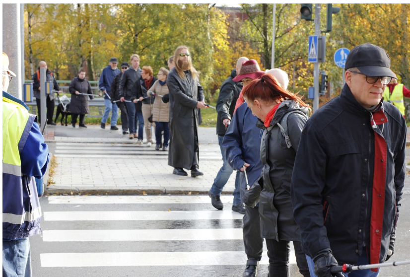
Valkoisten keppien letka osoitti mieltä Gotlanninkadun liikennejärjestelyjä vastaan Helsingissä 2017.

kuitenkin päätyä siihen, ettei hän saa mukaansa avustajaa tai kuukausittaiset asiointimatkat taksilla eivät enää riitä kulttuurielämään osallistumiseen.