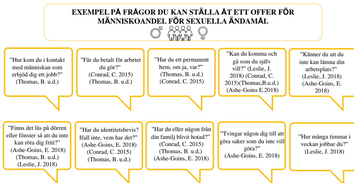
Figur 1 Exempel på frågor till offer

hälsa rekommenderas för att eventuellt kunna identifiera ett offer för människohandel. Kännetecknen att observera är om personen bor med sin arbetsgivare, synliga tecken på våld, begränsad frihet och orimlig skuldbörda. (Ihmiskauppa.fi, B. u.å.).