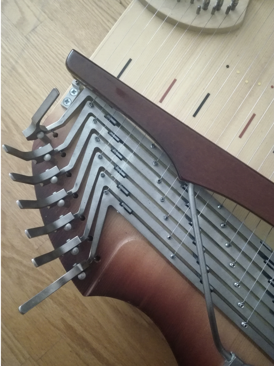
Kuva 2. Kanteleen koneisto.

Myös soittokokeilujen aikana kirjoitin ajatuksiani ylös ajatuskarttatyyppisesti. Jos löysin hyvän idean saatoin myös äänittää sen puhelimen ääninauhuriin, jotta se pysyisi tallessa ja voisin palata siihen myöhemmin. Soittovaihetta toistin useita kertoja, mutta mitään en harjoitellut ”ulkoa” tai niin tarkaksi, että soittaisin sen samalla lailla uudestaan, vaan annoin tilaa improvisoinnille ja tilaa muutoksille. Improvisaatio- ja muutosvara olikin hyvä, sillä videoihin tuli vielä joitakin leikkauksellisia muutoksia äänityspäivänä.