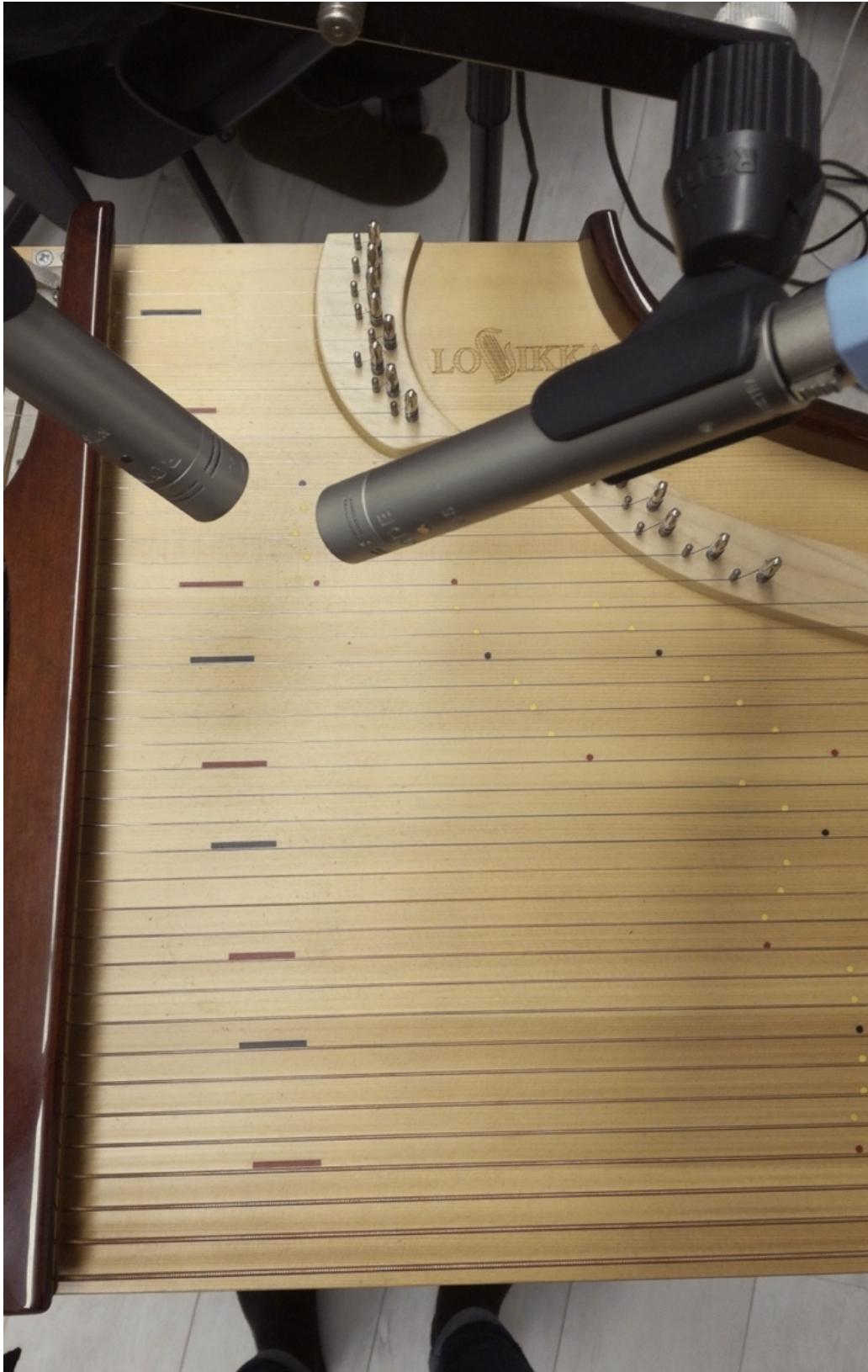
Kuva 3. Äänitystilanne (Kuva: Heta Laakkonen).