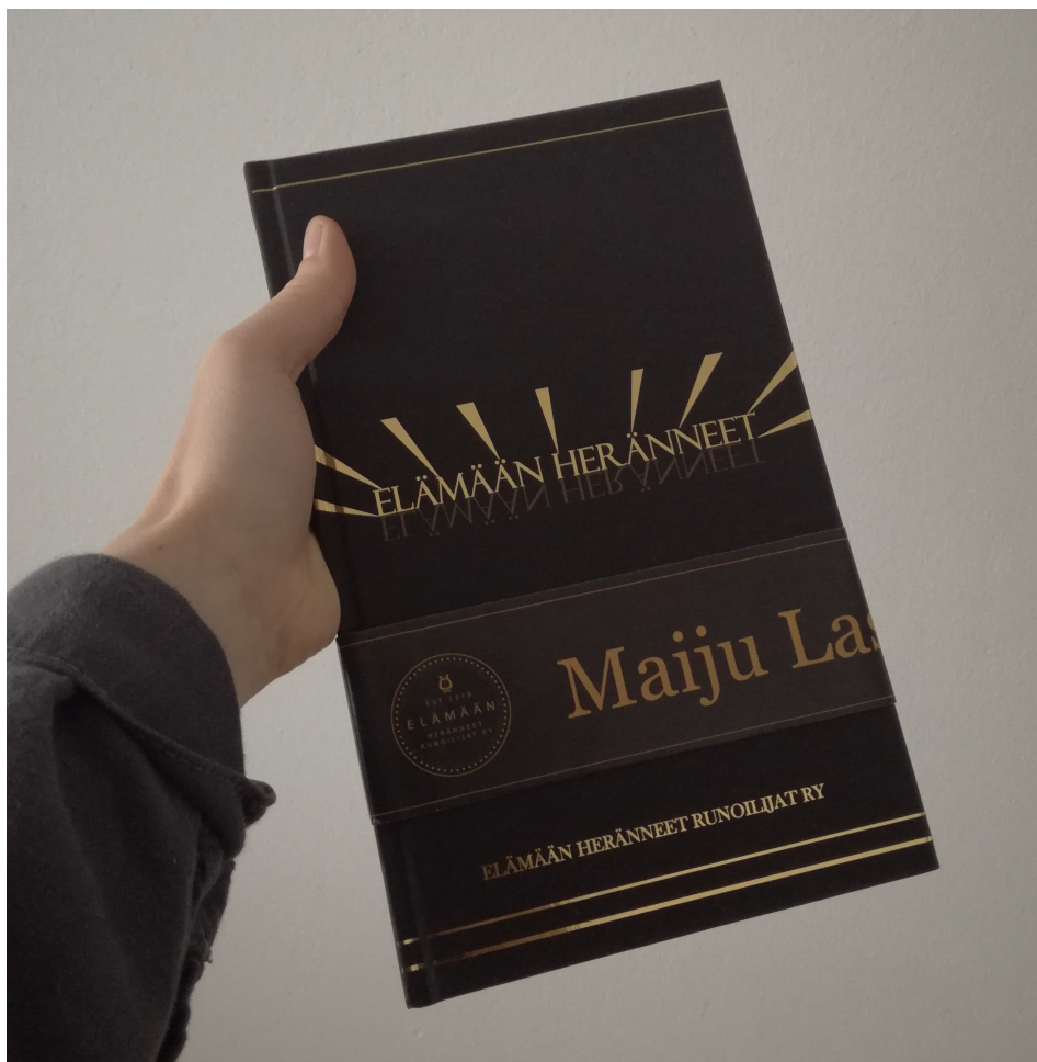
Kuva 1. Elämään heränneet -teos.

Minun tehtäväni oli luoda runoteoksen audiovisuaalisen osan seitsemään runofilmiin musiikit. Opinnäytetyöni on taiteellinen, ja sen tavoitteena oli tuottaa musiikit edellä mainittuihin runofilmeihin. Opinnäytetyön kirjallisessa osuudessa kuvaan työni vaiheita ja tuotoksia. Raportti keskittyy kuvaamaan ainoastaan omaa osuuttani runofilmeistä eli niiden musiikkeja, sillä en ollut muissa projektin työvaiheissa mukana.