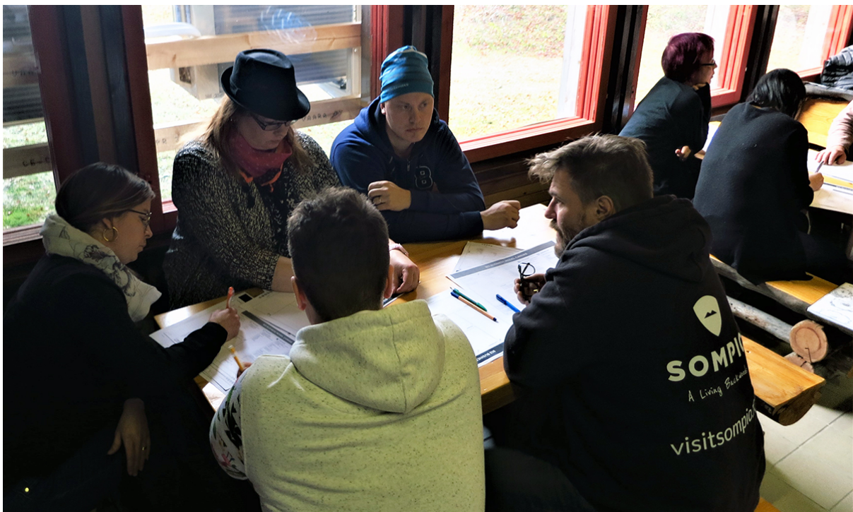
Kuva 2. Yhteiskehittämistä sompiolaisessa hengessä

Lapin ammattikorkeakoulu on ollut mukana reilun vuoden Matkailualueen kohdekokemuksen kehittämismalli -hankkeen kautta mahdollistajana ja väärtinä Sompion matkailualueen kehittämisessä. Jo ennen kehittämishanketta otettiin yhteistyön ensiaskeleet Tankavaaran Kultakylän kanssa heidän liiketoimintaprosessiensa kehittämisessä. Viime ajat Sompion matkailualue on kehitetty vahvasti yhteiskehittämisen periaatteilla sompiolaisessa hengessä. Siinä inhimillisyys, kaikkien osapuolten kunnioitus ja kumppaneiden eli väärtien erilaisten vahvuuksien ja kokemusten hyödyntäminen arjessa ovat olleet toimintaa voimakkaasti ohjaavia periaatteita. Pohjois-Sodankylän matkailuyhdistyksen aktiivinen rooli on tässä ollut merkittävä. Matkailuyrittäjät Sompiossa, Sodankylän kunnan matkailutoimi sekä Lapin ammattikorkeakoulun matkailutoimijat ovat löytäneet aidosti toisensa ja verkostoituneet arjessa matkailualueen kehittämiseksi.